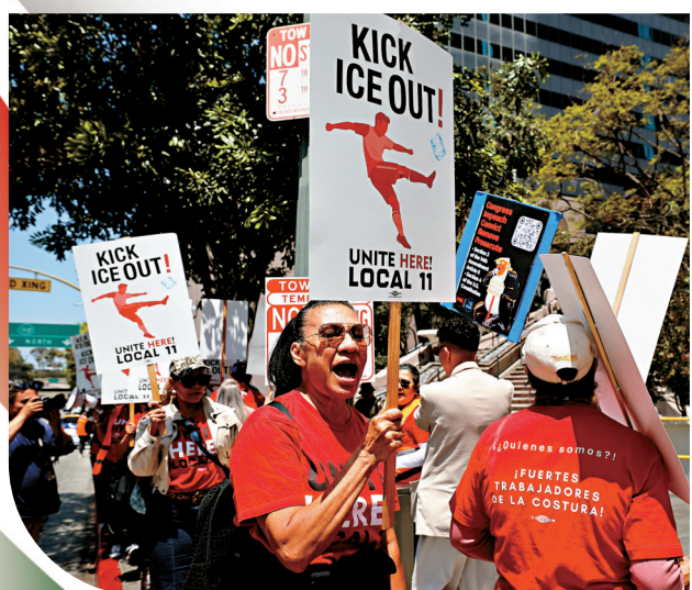
●許多民眾均對移民及海關執法局(ICE)人員感到害怕。圖為工會示威反對ICE進駐場館。資料圖片