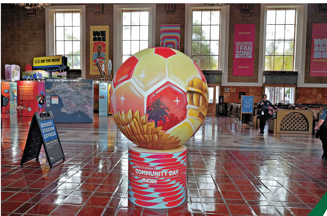
●圖為位於洛杉磯聯合車站的世界盃球迷區，沒有球迷門可羅雀。資料圖片