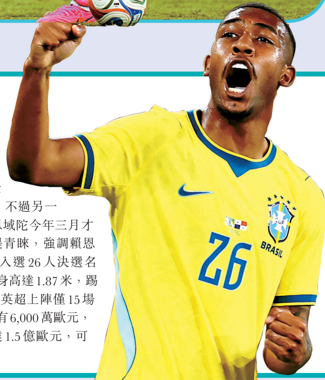
●賴恩域陀獲安察洛堤賞識。

「足球王國」巴西向來人才輩出，雖然備受期待的新星艾斯迪華奧因傷無緣今屆世界盃，不過另一天才賴恩域陀今年迅速冒起。年僅19歲的賴恩域陀今年三月才首度披上國家隊球衣，但已得到主帥安察洛堤青睞，強調賴恩域陀在國家隊有着光輝未來，最終更欽點他入選26人決賽名單。今年一月才加盟英超般尼茅夫的賴恩域陀身高達1.87米，踢法直接侵略性高，擅長單對單「硬爆」對手，英超上陣僅15場已交出五個入球、兩次助攻，雖然目前身價只有6,000萬歐元，但他與般尼茅夫的合約中的解約金條款卻高達1.5億歐元，可見球會對這名巴西右翼潛力的肯定。