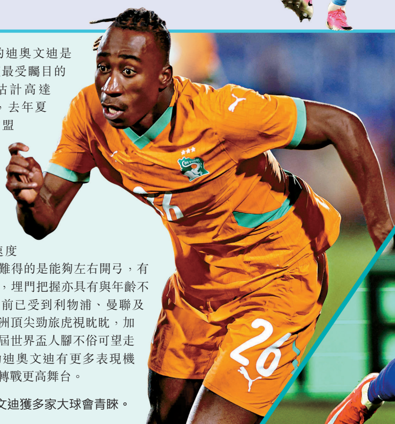
●迪奧文迪獲多家大球會青睞。

年僅19歲的迪奧文迪是當今非洲球壇最受矚目的新星，身價估計高達9,000萬歐元，去年夏天轉戰德甲加盟RB萊比錫，首季已貢獻13個入球及10次助攻，慣常擔任左翼的他有着天賦異稟的速度和協調性，更難得的是能夠左右開弓，有遠射能力之外，埋門把握亦具有與年齡不符的冷靜，目前已受到利物浦、曼聯及巴塞隆拿等歐洲頂尖勁旅虎視眈眈，加上科特迪瓦今屆世界盃人腳不俗可望走得再遠，有助迪奧文迪有更多表現機會，力爭來季轉戰更高舞台。