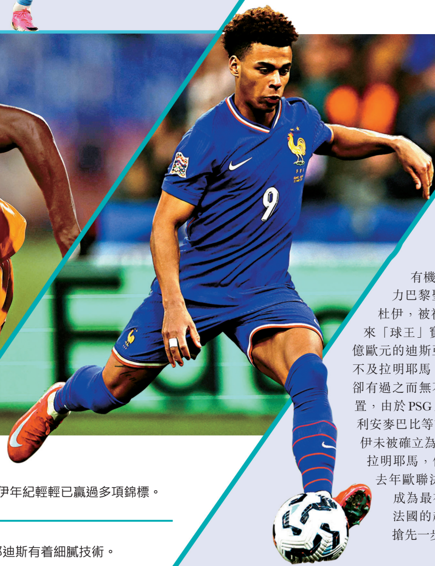
●杜伊年紀輕輕已贏過多項錦標。