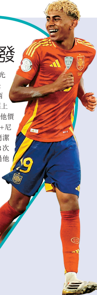
●耶馬已成為西班牙主力球員。

雖然年僅18歲，但拉明耶馬毫無疑問已配得上「巨星」光環。當美斯首次世界盃之旅還只是替補球員，拉明耶馬卻是以西班牙絕對核心的姿態首度亮相世界盃，更是兩年助西班牙於歐國盃稱王的功臣之一。轉會權威網站為拉明耶馬標上的兩億歐元身價只是紙面數字，身為巴塞隆拿「非賣品」的他價值已非金錢所能衡量。司職右翼的拉明耶馬被喻為「美斯+尼馬」的混合體，擁有靈巧優美的盤球技巧之餘，亦能以最簡潔的動作射門或助攻，今季在巴塞上陣45場有24個入球、18次助攻，無論身體素質及球場視野都較兩年更為成熟，不過他上季季尾受傷後休養接近一個月，西班牙決賽前對秘魯的熱身賽亦未能趕及上陣，需要時間重拾比賽狀態。