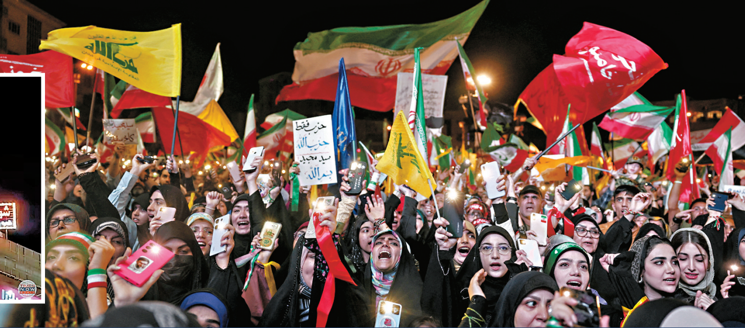
● 伊朗襲擊以色列後，德黑蘭民眾在反美集會中歡呼。