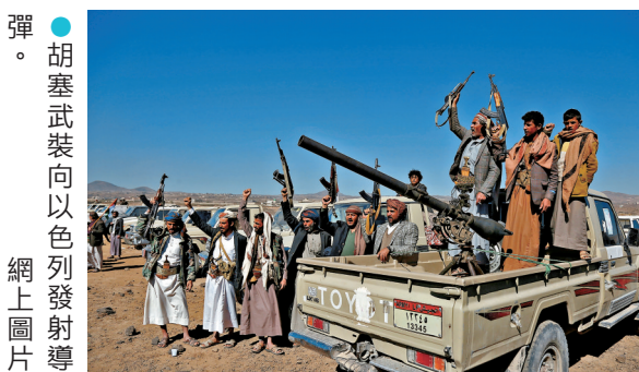
● 胡塞武裝向以色列發射導彈。

伊拉克民兵武裝「伊斯蘭抵抗組織」8日亦宣布，將參與針對以色列的軍事行動。伊拉克什葉派武裝組織「真主旅」7日晚則表示，若美國介入當前伊以之間的軍事衝突，其將打擊包括軍事基地在內的美國在中東地區利益。