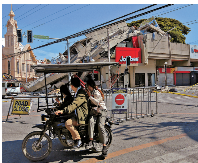
● 桑托斯將軍城一幢建築物倒塌。

菲律賓火山暨地震研究所向棉蘭老島多個地區發出海嘯警報，呼籲民眾遠離水邊並前往高地避難。太平洋海嘯預警中心亦向印尼、帛琉等地發出警報。日本氣象廳向太平洋沿岸地區發布海嘯注意報告，預測浪高可達1米，呼籲