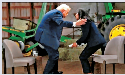
● 特朗普受訪期間憤然離席。

香港文匯報訊 美國總統特朗普7日接受美國全國廣播公司(NBC)專訪時，就美伊戰爭走向、核協議談判進程及相關爭議作出至今最詳盡的表態，但訪談最終因特朗普不滿主持人追問選舉和「反武器化」基金問題而針鋒相對，特朗普怒指咪高峰拂袖離席。