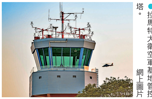
● 拉馬特大衛空軍基地管塔。網上圖片

線全面停火，但美以雙方此後並未履行承諾。聲明指責以方繼續在黎巴嫩開展軍事行動，並指責美以在霍爾木茲海峽、阿曼灣和印度洋針對伊朗船隻和沿海目標採取行動，破壞停火安排。伊方7日晚對以色列的導彈打擊屬「警告性質」，若以方相關軍事行動繼續升級，伊方未來回應範圍將進一步擴大，可能覆蓋地區內更多美國和以色列相關目標。