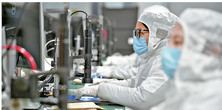
●5月內地半導體企業經營熱度同比增長8.7%，增速較4月提高7.6個百分點。資料圖片

香港文匯報訊 國家發展改革委國家信息中心昨日發布數據指，5月內地線下消費支付金額同比增長2.4%，增速較上月提高0.7個百分點，消費市場活力迸發；人工智能、人形機器人等前沿領域資本投資金額同比增長約5倍，產業發展向新向智，新興產業拔節生長。