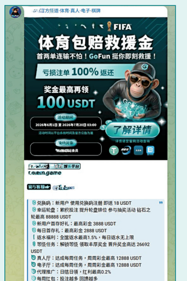
●有外圍平台用包賠 100% 等字樣做噱頭，實際是誘人陷阱。 Telegram 截圖