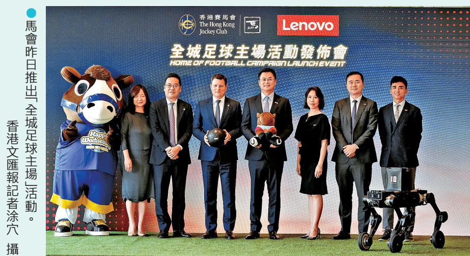
●馬會昨日推出「全城足球主場」活動。

他特別預告，世界級「傳奇球星」將於今晚亮相跑馬地馬場，場內並設置「Lenovo 體驗館」，是一個沉浸式的人工智能（AI）足球體驗專區，展示該公司於今屆世界盃所應用的相關科技。香港將成為賽事主辦地區以外，唯一能讓球迷親身