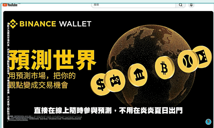
●YouTube 上已有 KOL 開始宣傳加密貨幣平台幣安推出的預測市場。 YouTube 截圖