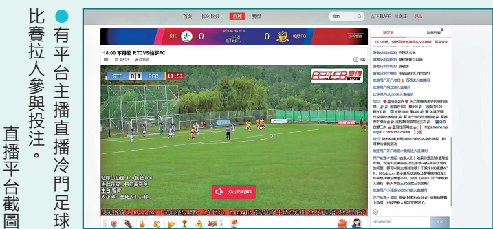
●有平台主播直播冷門足球比賽拉人參與投注。