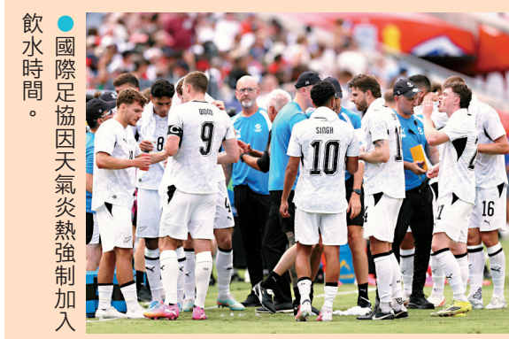
●國際足協因天氣炎熱強制加入飲水時間。

第四項新措施是球證新增兩個情況可以出示紅牌，包括球員以手掩口向對手說話，以及球員或職員為抗議判決集體離場等情況，而導致比賽腰斬的球隊原則上將被判處落敗。