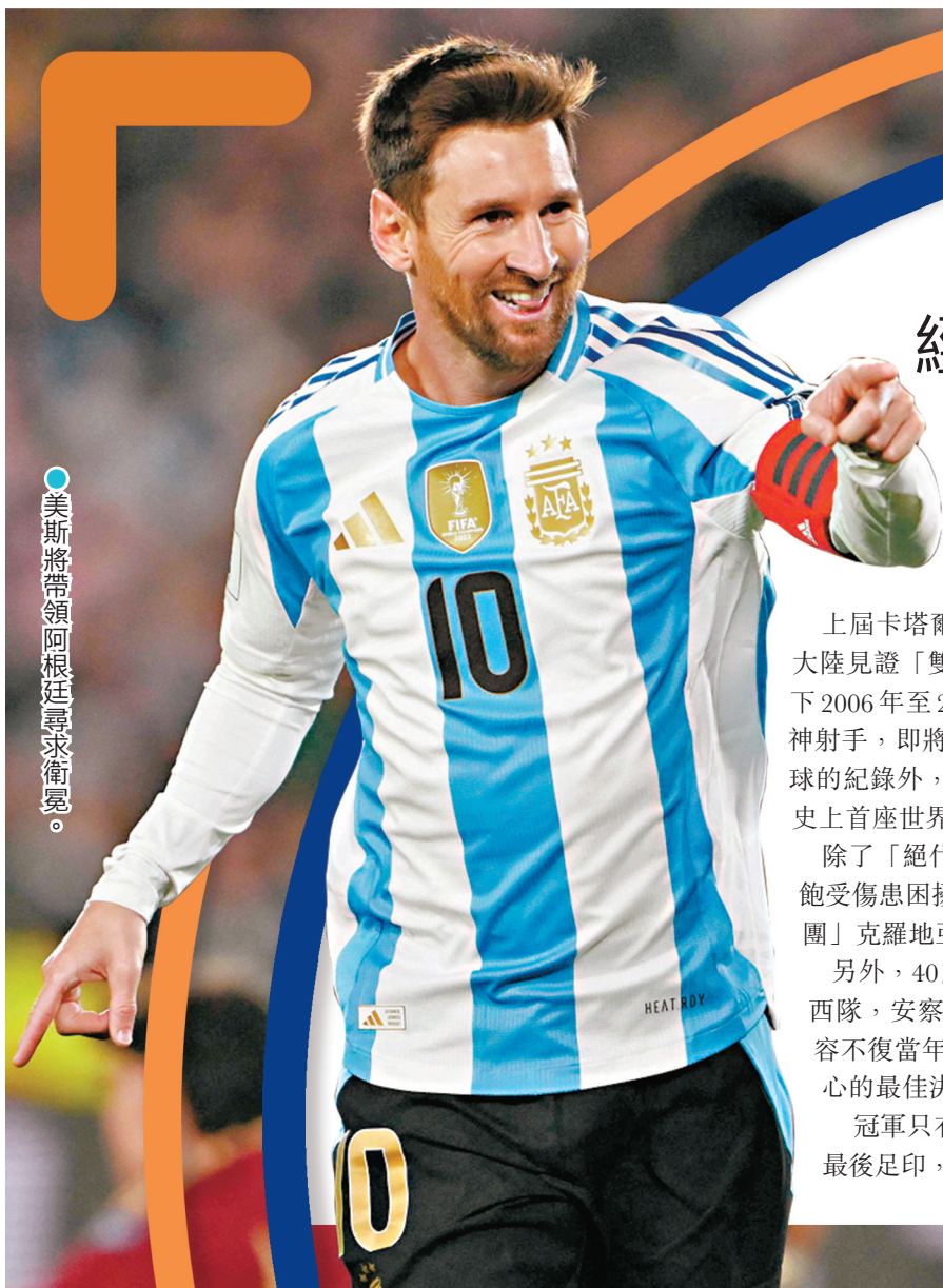
●美斯將帶領阿根廷尋求衛冕。

冠軍只有一個，「諸神」注定無法全部圓滿。然而，這批傳奇在世界盃舞台留下的最後足印，早已點燃了幾代球迷心中的足球火焰，足夠在北美賽場留下最動人的樂章。