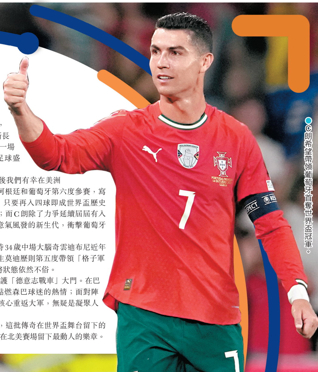
●C朗希望帶領葡萄牙首奪世界盃冠軍。