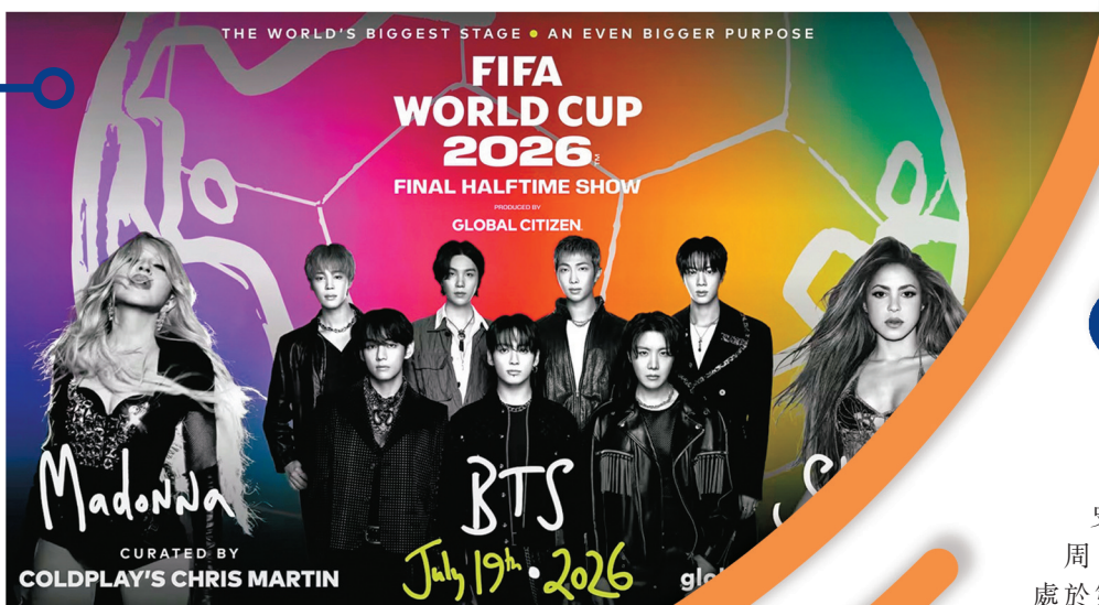
●世界盃決賽首度增設中場表演。 FIFA官網截圖

今屆世界盃除了應援曲《GOALS》由韓國女團BLACKPINK成員LISA、巴西歌手Anita及尼日利亞唱作人Rema三名世界知名歌手演繹外，開幕禮表演陣容亦星光熠熠，美加墨三國都有各自的開幕禮，流行巨星Katy Perry及南非小天后Tyla等明星均會登場表演，而決賽亦會加插類似「超級碗」風格的中場表演，麥當娜、夏奇拉及韓國人氣男團防彈少年團(BTS)亦會粉墨登場，為這個四年一度的足球盛事增添娛樂元素。