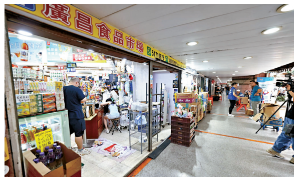
●昨日中午約12時開始，荃灣中心逐步恢復電力供應，商舖恢復營業。