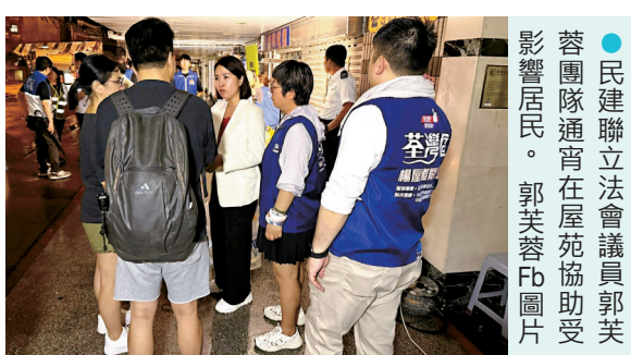
●民建聯通宵在屋苑協助受影響居民。