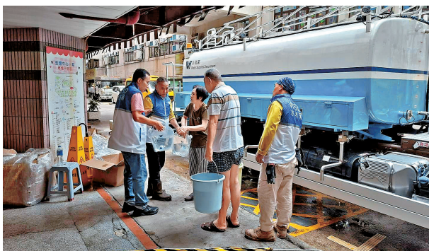
●水務署通宵設置16個水箱及兩架水車，方便居民及商戶取用臨時食水。