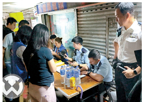
●荃灣警區在屋苑設立臨時指揮中心統籌工作。

香港文匯報訊(記者 蕭景源)荃灣中心一期總掣房電力系統前日(8日)發生故障，5座大廈及商場逾千戶居民無水電供應。炎熱天氣及黑色暴雨下，多個政府部門、荃灣、葵青民政事務處，與兩區逾百名關愛隊隊員和義工、區議員，採取跨區聯動參與支援，協助居民渡過難關。經過通宵搶修，昨日中午陸續恢復水電供應。民政及青年事務局長麥美娟認為，夏季天氣炎熱多雨，樓宇電力裝置較易受天雨、滲水或用電量上升等因素影響而出現故障，業主立案法團及物業管理公司都有共同責任保障居民生活。