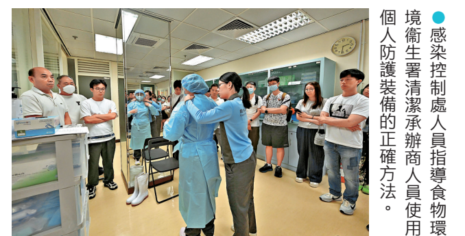
●感染控制處人員指導食物環境衛生署清潔承辦商人員使用個人防護裝備的正確方法。

中心感染控制處上月亦聯同醫管局傳染病控制培訓中心，為公私營醫護人員舉辦有關埃博拉病的講座，超過1,500人參與。講座旨在加深醫護人員對埃博拉病的認識及應對措施，包括診斷、臨床治理及感染控制措施等。中心會繼續密切監察海外最新發展和世衛的最新建議，按風險評估採取適當的跟進和防控措施，以保障公共衛生和市民健康。