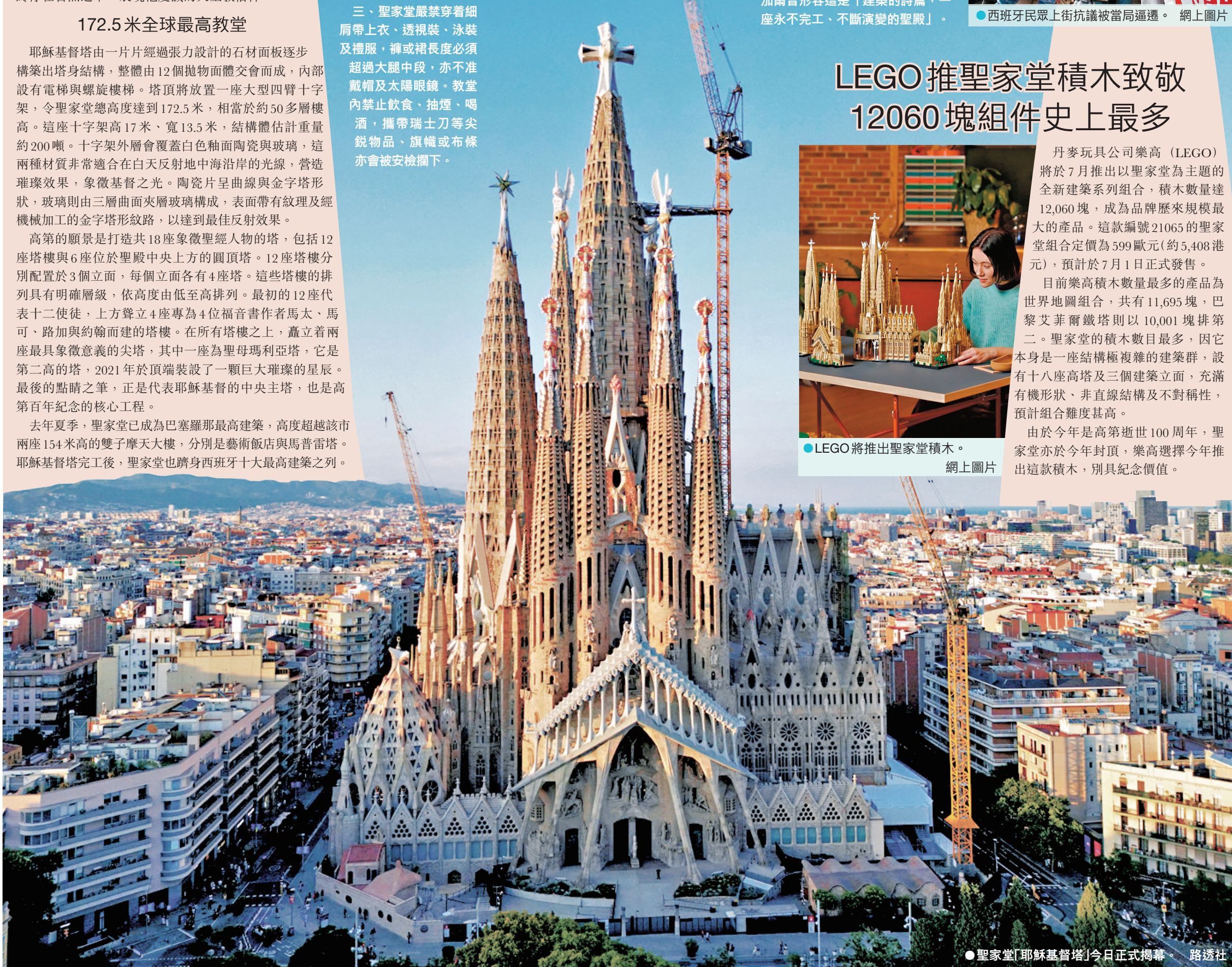
●聖家堂「耶穌基督塔」今日正式揭幕。

由於今年是高第逝世100周年，聖家堂亦於今年封頂，樂高選擇今年推出這款積木，別具紀念價值。