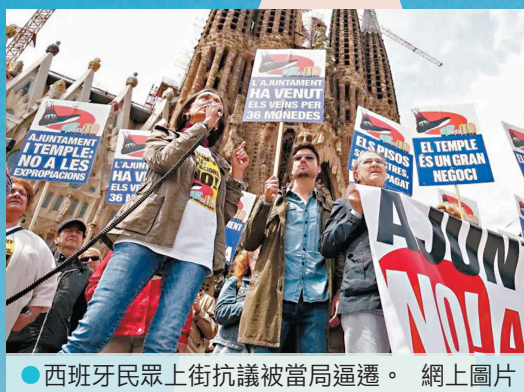
●西班牙民眾上街抗議被當局逼遷。

目前聖家堂每年吸引約500萬名遊客參觀，門票收入高達上億歐元，用以維持後續工程。詩人馬拉加爾曾形容這是「建築的詩篇，一座永不完工、不斷演變的聖殿」。