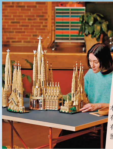
●LEGO將推出聖家堂積木。

丹麥玩具公司樂高(LEGO)將於7月推出以聖家堂為主題的全新建築系列組合，積木數量達12,060塊，成為品牌歷來規模最大的產品。這款編號21065的聖家堂組合定價為599歐元(約5,408港元)，預計於7月1日正式發售。