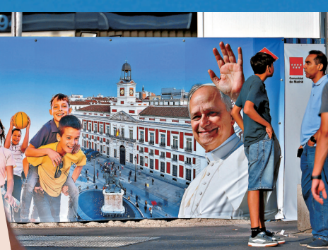
●人們走過馬德里街上的教宗來訪宣傳海報。