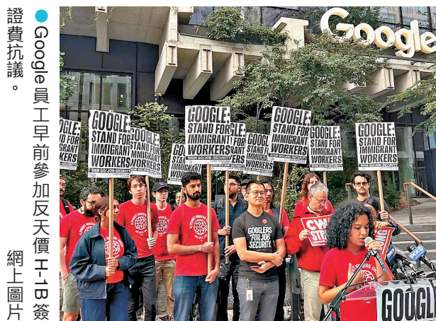
●Google員工早前參加反天價工日簽證費抗議。