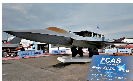
●德國放棄與法國的FCAS項目。