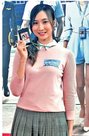
●鍾柔美稱若開鑿要先增值自己。