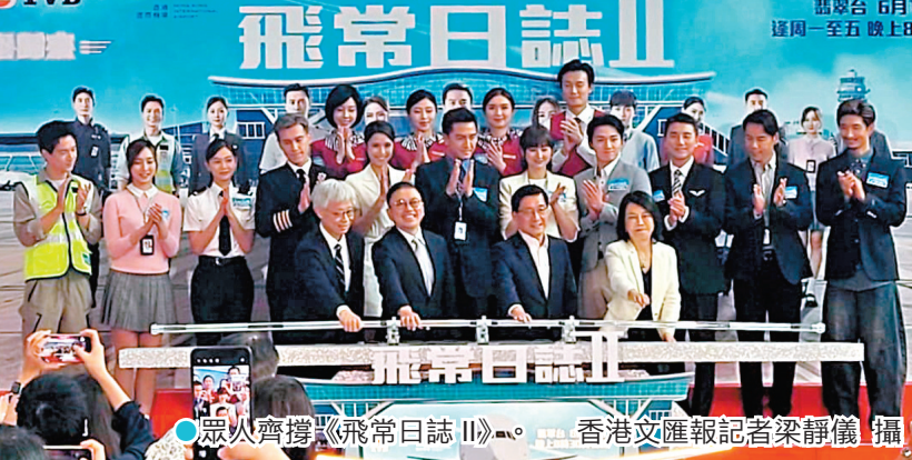
●眾人齊撐《飛常日誌II》。