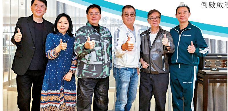
●眾人齊為譚詠麟演唱會點讚。