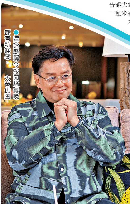
●譚詠麟稱今次開騷每晚都有新鮮感。