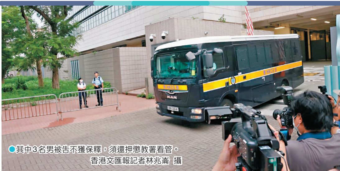
其中3名男被告不獲保釋，須還押懲教署看管。

9名被告包括5男2女(年齡介乎33歲至60歲)及宏福苑大維修工程顧問公司鴻毅和總承建商宏業建築。其中，警方落案起訴3名男子和兩間公司合共5項誤殺罪；而廉署起訴5男2女和兩間公司合共20項控罪，包括串謀詐騙、洗黑錢、企圖妨礙司法公正，以及逃稅。案件昨日在西九龍裁判法院提訊。