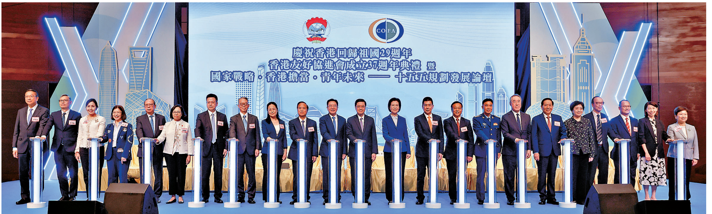
●香港友好協進會昨日舉辦「慶祝香港回歸祖國29周年、香港友好協進會成立37周年典禮暨國家戰略·香港擔當·青年未來——『十五五』規劃發展論壇」。

香港友好協進會昨日舉辦「慶祝香港回歸祖國29周年、香港友好協進會成立37周年典禮暨國家戰略·香港擔當·青年未來——『十五五』規劃發展論壇」。香港特區行政長官李家超、中央政府駐港聯絡辦主任周霽等擔任主禮嘉賓並致辭。李家超表示，今年是國家「十五五」規劃開局之年，他正帶領特區政府全力編制香港首個五年規劃，制定具有戰略性、系統性的宏觀藍圖，為香港未來發展拓展新方向、開創新空間、注入新動能，公眾諮詢將於下周一展開。周霽表示，期待香港各界以主人翁姿態建真言、謀良策、出實招，全力支持特區政府編制好首個五年規劃，推動由治及興、引領未來發展。