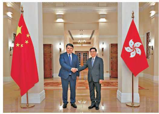
●行政長官李家超(右)在禮賓府與哈薩克斯坦副總理波茲姆巴耶夫會面。

香港文匯報訊 香港特區行政長官李家超昨日在禮賓府與哈薩克斯坦副總理波茲姆巴耶夫會面。