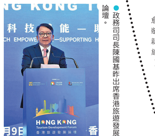
●政務司司長陳國基昨出席香港旅遊發展論壇。

他表示，今年是國家「十五五」規劃開局之年，旅遊是國家推動高質量發展的一個重要範疇，「十五五」規劃提出「深化以文塑旅、以旅彰文，推進旅遊強國建