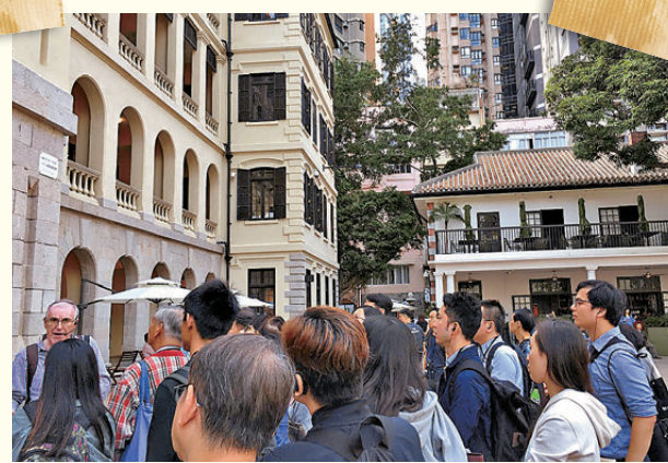
●「活化歷史建築夥伴計劃」至今已推展了24個項目，其中14個項目正在營運，累計參觀人次超過1,280萬。