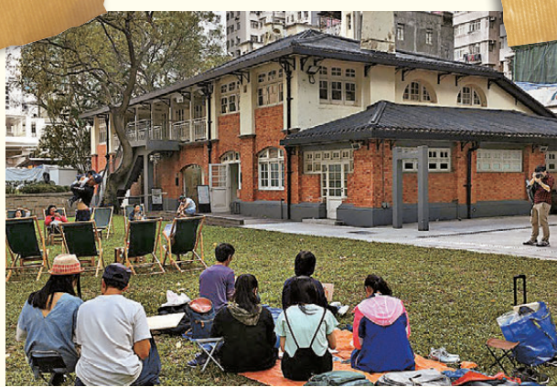
●全港現時共有138項法定古蹟及逾1,200幢歷史建築，融合中西文化特色。圖為公眾參與項目及主題研究資助計劃。

至於赤柱清真寺建於1936年至1937年間，是香港第二古老的清真寺，也是唯一一座坐落於監獄建築群內的清真寺。其建造由當時監獄署的印度和巴基斯坦籍穆斯林員工，聯同本地印度社群共同倡議、捐助並參與完成。赤柱清真寺以巴基斯坦拉合爾的巴德夏希清真寺為藍本，建築採用對稱布局，沿東西向的軸線而建，朝向麥加的克爾白（又稱「卡巴天房」）。混凝土平屋頂的邊緣築有垛口式女兒牆，拱廊式立面則飾有馬蹄形和蔥形的裝飾拱券。它雖然缺乏大部分清真寺常見的典型宣禮塔，但其建有設計簡約、以宛如宣禮塔的柱子作裝飾，仍能充分展現伊斯蘭建築特色。