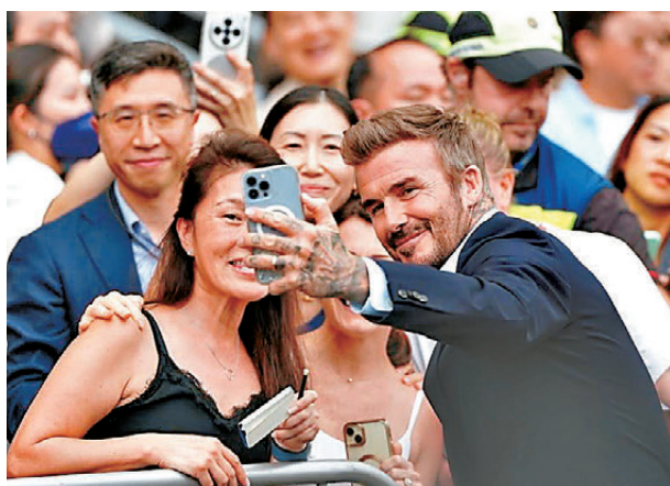
●碧咸昨現身跑馬地馬場，與球迷合照互動。

香港文匯報訊(記者 張發兒)2026世界盃將於周五(12日)揭幕，香港賽馬會(馬會)推出「全城足球主場」系列活動，其中「萬人迷」碧咸昨日現身跑馬地馬場，除了與觀眾互動之外，更親自體驗人工智