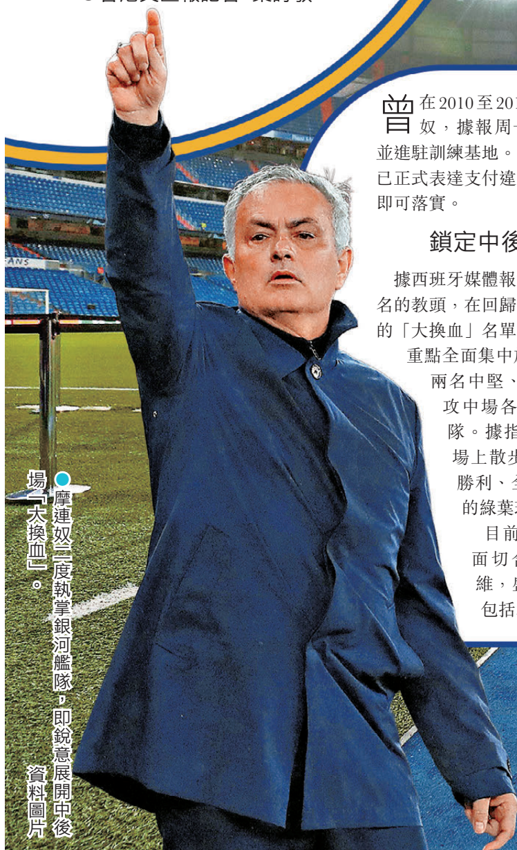
●摩連奴二度執掌銀河艦隊，即銳意展開中後場「大換血」。資料圖片

曾在2010至2013年球季執教皇馬的摩連奴，據報周一(8日)已飛抵馬德里並進駐訓練基地。賓菲加的公告指出，皇馬已正式表達支付違約金的意向，手續完成後即可落實。