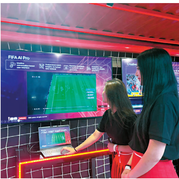
●人工智能足球體驗專區設有豐富的互動體驗。

「Lenovo 體驗館」是一個沉浸式人工智能足球體驗專區，展示其在FIFA世界盃2026中所應用的相關科技。香港將成為賽事主辦地區以外，唯一能讓球迷親身體驗此項科技的城市。這個由AI驅動的足球專區將設有豐富的數碼互動體驗，展示科技如何全面提升運動表現、分析能力及增加與球迷的互動。