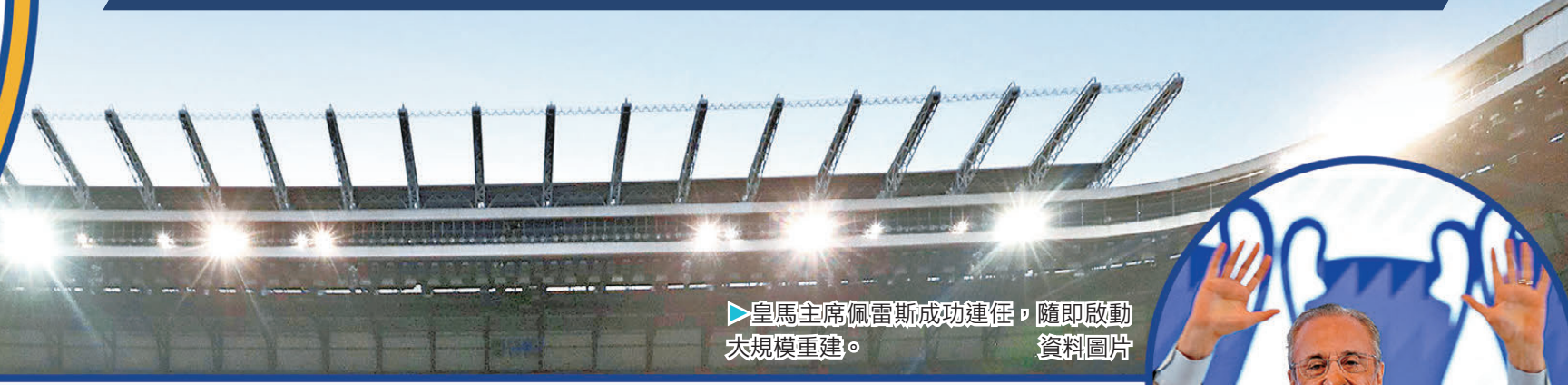
▶皇馬主席佩雷斯成功連任，隨即啟動大規模重建。資料圖片