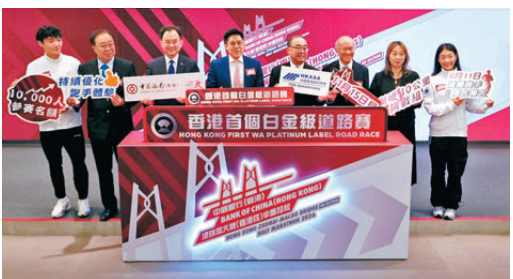
●田總昨為港珠澳半馬賽事舉行啟動儀式。

2026年6月15日(星期一)中午12時截止；公眾抽籤則於2026年6月18日下午2時開始，至2026年7月2日中午12時截止。