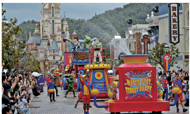
●今次是迪士尼樂園首次以Pixar作主題的夏日活動。

今次是樂園首次以Pixar作主題的夏日活動，直至8月31日。活動包括長約8分鐘的全新夜間匯演「Pixar好友星空匯演」，透過無人機、噴泉與投影效果，將多個Pixar動畫經典場景呈現於夜空。此外，日間的「Pixar水花大街派對」亦再度回歸，包括胡迪、巴斯光年等多個Pixar角色將搭乘主題花車巡遊，與遊客近