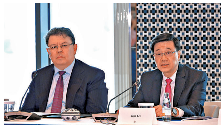
●行政長官李家超(右)昨日在香港出席阿拉套市發展圓桌會議。左為哈薩克斯坦副總理波茲姆巴耶夫。

他續說，香港特區政府未來會推出北都專屬法例加快發展，將以產業、科技、大學城和宜居宜業作為發展目標。阿拉套市和香