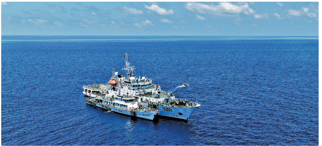
●早前，中國海警在黃岩島海域巡航值守。資料圖片

宋忠平指出，有利，則體現在這次制裁精準打擊挑釁。以往部分菲政客誤以為口頭挑釁、輿論炒作無需承擔成本，此次制裁徹底打破這種僥倖心理。有節則體現在制裁克制，尺度得當。從官方發布制裁細則來看，本次反制針對性極強、邊界清晰、尺度精準，既實現了懲戒效果，又最大限度規避對菲律賓普通民眾、中菲民間合作的誤傷。