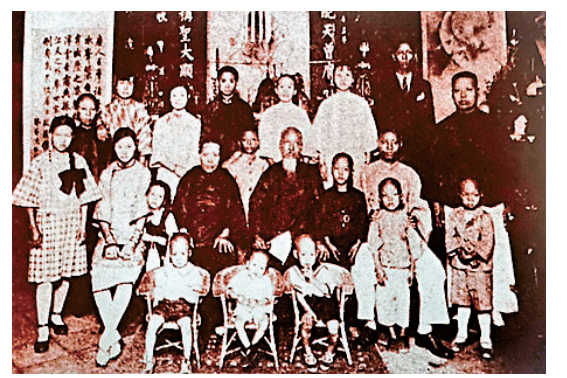
●台灣同胞對祖國傳統文化的眷戀並未因日本殖民當局的鎮壓而減弱。圖為堅持穿着傳統中式服飾的台灣家庭合照。

為壓制台灣人民的反抗意識，日本殖民當局還實施了嚴厲的言論與出版管控，構築起思想禁錮的「鐵幕」。殖民統治期間，日本當局對言論自由進行全面箝制，即便在日本國內可自由出版的雜誌期刊，輸入台灣時也需接受嚴苛審查，甚至被禁止進口。報紙出版的管控更為嚴厲，沒有總督的同意，任何報紙都無法出版。在長達半個世紀的時間裏，台灣人民僅擁有《台灣民報》這一份中文日報的出版許可。到日據後期，日本殖民當局發布政令，取消所