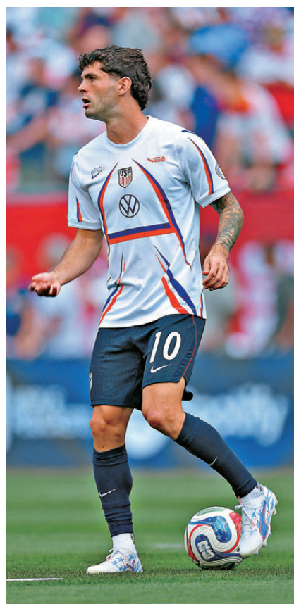
●基斯甸普列錫領軍硬撼巴拉圭鐵桶陣。資料圖片

在普捷天奴執教下，美國鋒線相當重視速度及走位能力，面對會採用「泊大巴」戰術的巴拉圭，正好可以利用「小組入滲」及「走位」撕破防線。另外，美國曾在七個月前友誼賽與巴拉圭交手，並以2:1取勝，後者當時展現出極強的身體對抗能力，美國今仗或需避免因此被對方打亂節奏，更要控制情緒，尤其是出現死球機會時，切勿與對方推撞及發生衝突，要專注當下，才能避免被對手有機可乘。