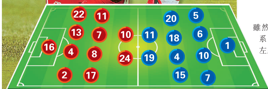
加拿大預計陣容 VS 波斯尼亞預計陣容