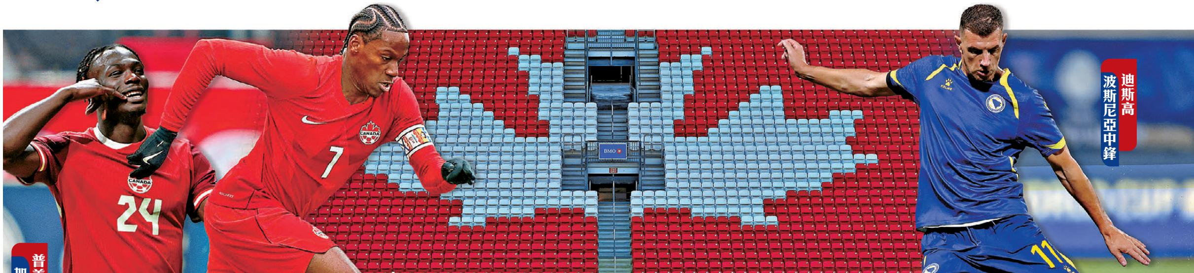
普美斯大衛 加拿大前鋒