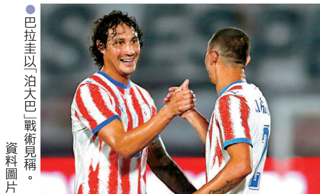
●巴拉圭以「泊大巴」戰術見稱。

不過，葡軍仍在尾段鎖定勝局。75分鐘，干斯卡奧沿右路引球切入中路，起左腳施射遠柱得手，助葡萄牙以2:1奠勝。馬天尼斯賽後極為C朗辯護，強調本來就預定給他45至60分鐘去提升狀態，並欣然表示這兩場友賽已達到練兵效果，球隊正無傷無痛迎接世界盃。