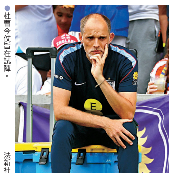
●杜曹今仗旨在試陣。法新社

香港文匯報訊(記者 葉詩敏)美加墨世界盃開賽在即，「三獅軍團」英格蘭於最後一場熱身賽，憑藉迪格蘭斯、安東尼哥頓及奧尼屈堅斯各建一功，以3:0輕取缺少六名主力的哥斯達黎加。球隊