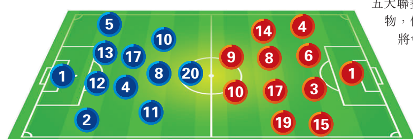
美國預計陣容 VS 巴拉圭預計陣容