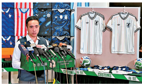
●香港海關在世界盃開鑼前展開專項行動打擊跨境走私和網售冒牌貨。

月10日展開針對性行動，重點檢查物流中心的高風險轉口貨物，打擊跨境轉運與世界盃相關的冒牌貨品，共破29宗跨境走私冒牌貨，拘捕一名36歲男