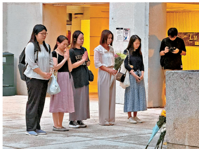
市民昨晚到太古城哀悼墮樓的母女。