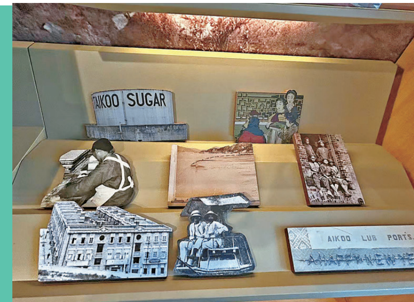
●太古歷史檔案館中藏有早年遺址紀念圖片。