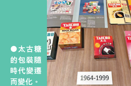
●太古糖的包裝隨時代變遷而變化。

在香港百年城市發展與生活變遷的長河裏，不少商業品牌隨時代浪潮起落，唯有少數品牌深耕本土日常，沉澱為屬於香港的文化印記。太古糖扎根香港逾百載，伴隨城市工業化轉型、民生生活迭代，從經典食糖產品一步步蛻變為香港本土文化符號。其包裝與產品的百年演變，不僅是品牌發展的軌跡，更是香港人對生活品質、實用需求、生活美學的觀念變遷縮影，以煙火日常，見證香港城市與文化的生生不息。