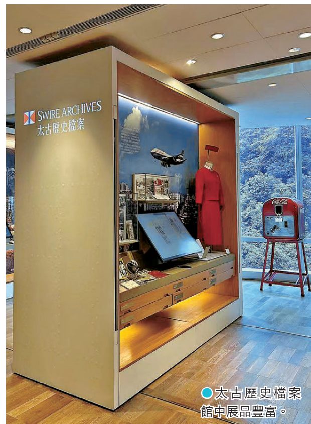
●太古歷史檔案館中展品豐富。

事實上，太古糖多年來都始終緊跟香港城市節奏，以多元形式融入時代生活。早在品牌110周年之際，太古糖便順應當時的通訊文化，以市民日常必備的電話卡為