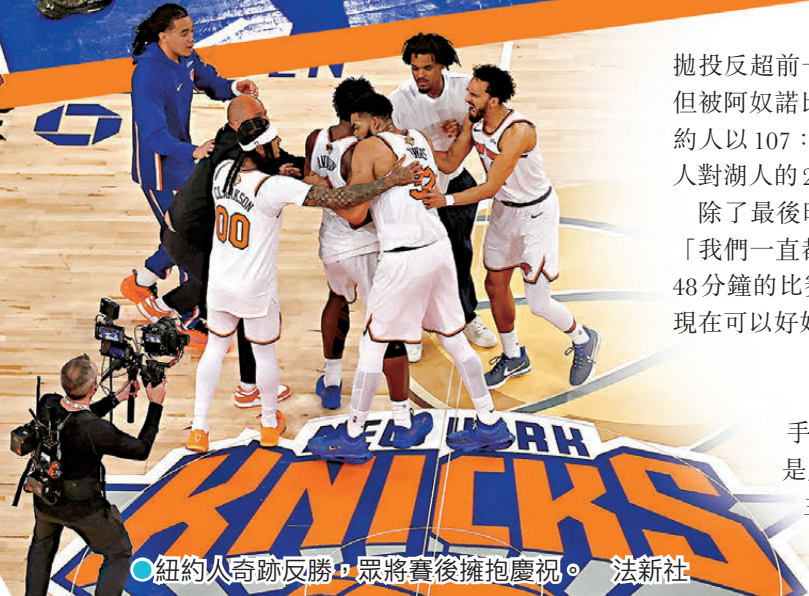
●紐約人奇跡反勝，眾將賽後擁抱慶祝。