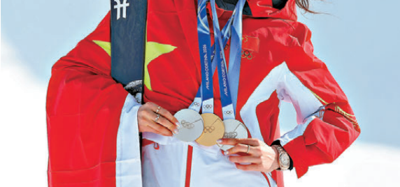
亞馬，網球選手艾卡拉斯，世界一級方程式車手諾里斯以及田徑名將基普真等。