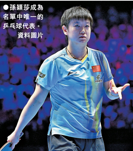
●孫穎莎成為名單中唯一的乒乓球代表。資料圖片

香港文匯報訊 據新華社報道，美國《時代》雜誌網站近日發布2026年百大體育影響力人物名單，中國運動員孫穎莎和谷愛凌雙雙入選。