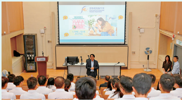
●食環署署長吳文傑與全港的專責人員會面。