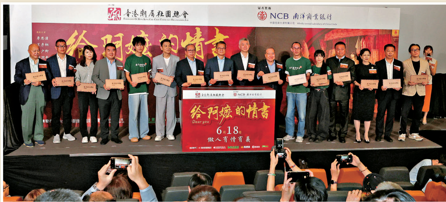
●眾嘉賓共寄「僑批」，盼情義傳萬家。