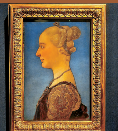
●佛羅倫薩畫派重要代表皮耶羅·德爾·波拉約洛1475年創作的木板蛋彩與油畫《青年女子肖像》。