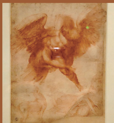
●米開朗琪羅紙本粉筆畫《劫掠伽倪墨得斯》描繪了年輕牧羊人伽倪墨得斯的故事。