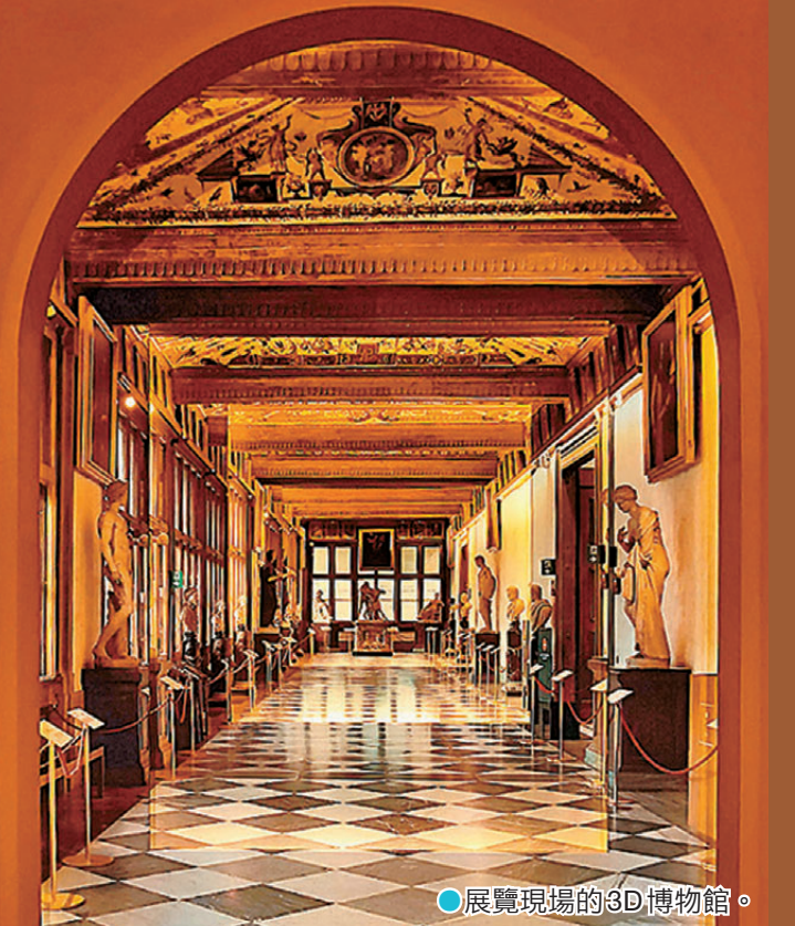
●展覽現場的3D博物館。

本次展覽由中國美術館、意大利烏菲齊美術館和寶豐集團、燕寶慈善基金會共同主辦，旨在通過藝術作品對話，增進中意兩國人民相互了解與文化認同。作為世界最重要的美術館之一，位於意大利文藝復興早期中心佛羅倫薩的烏菲齊美術館，以完整的收藏體系和豐富的文藝復興藝術珍品享譽全球，素有「文藝復興藝術寶庫」之稱。