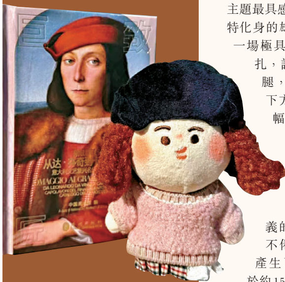
●中國美術館依託展覽推出的布偶、冰箱貼、帆布包等文創產品近日在網絡上爆火。這些產品兼具藝術價值與實用性，深受觀眾喜愛。