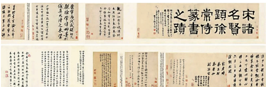
●《宋名賢題徐常侍篆書之跡》手卷