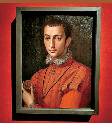
●亞歷桑德羅·阿洛里的木板油畫《弗朗切斯科一世·德·美第奇肖像》，是肖像畫中經典之作。