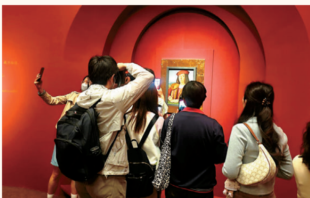
●每一幅作品前都擠滿觀眾。

板油畫《手拿蘋果的青年男子肖像》在第二章「群星璀璨——拉斐爾和16世紀意大利繪畫」中展出。這一章還展出拉斐爾的另外2幅珍貴肖像畫《伊麗莎白·貢扎加肖像》和《女子肖像》，以及蓬托爾莫、布隆齊諾等樣式主義藝術家的作品，呈現意大利文藝復興與樣式主義繪畫的發展風貌。