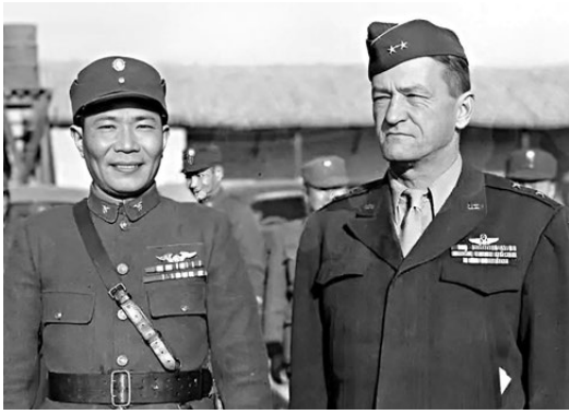
●陳納德（右）與國民黨空軍首任總司令周至柔合影。

但國民黨有關軍政部門經常指責陳納德的民航空公司是「唯利是圖的僱傭軍」，他們索要高昂的天價，提供的卻是低效服務。據國民黨軍聯勤總部負責軍官反映，當時陳納德的公司運作是典型的僱傭兵思維，一切行動均以收錢為目的。公司僱用的空勤人員都是唯利是圖的僱傭兵，人員素質不高，每次行動都以分錢為目的。他們為國民黨軍空運是按次收費，且收費標準極高。在向長春被圍的國民黨軍空投時，陳納德航空隊要索的運費幾乎佔被圍軍隊軍費開支的一半。淮海戰役期間，因國民黨軍聯勤總部拖欠陳納德的運費，陳納德一度暫停往北線的運輸。據說，陳納德1948年底冒險