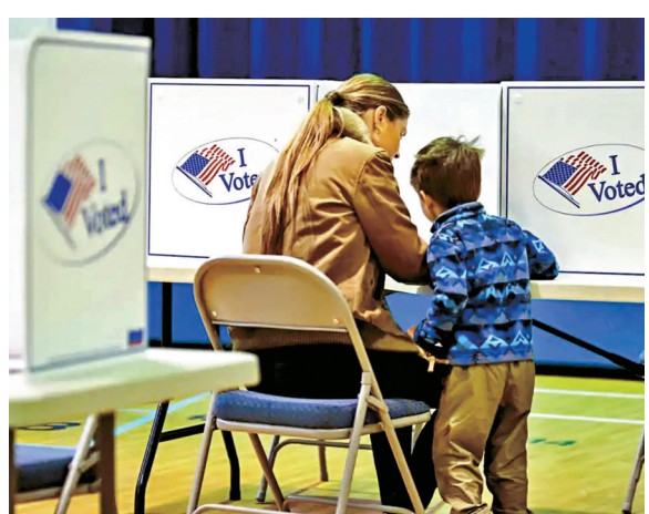
●美國民眾生活成本飆升，對特朗普的不滿與日俱增。圖為美國選民。網上圖片

分析指出，眾議院最終席位很可能出現民主黨235席對共和黨196席的局面，餘下4席勝負難料。若共和黨在中選落敗，後續矛盾將進一步激化，民主黨掌權後勢必對特朗普展開清算，他的處境將極其危險。外界憂慮特朗普為求自保，可能鋌而走險發動猛烈反撲，兩黨在選舉問題上的撕裂與公開對抗會進一步升級。