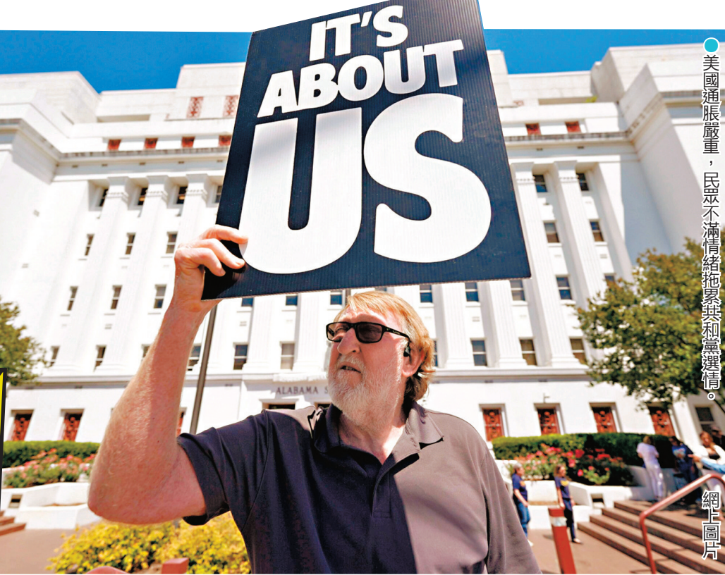
●美國通脹嚴重，民眾不滿情緒持續蔓延，共和黨選情。

多項民調顯示，美國汽油價格因伊戰飆升45%，白宮耗資數十億美元興建宴會廳的爭議亦引發質疑，獨立選民對他的支持率持續下滑。與此同時，被踢出門的議員或在任期最後數月內，聯手抵制特朗普的法案及人事提名，為他製造更多麻煩。當特朗普忙於黨內「復仇」時，民主黨人正加緊將初選勝利的共和黨對手與支持率低迷的總統綁架。特朗普清除異己看似風光，卻是在中選給自己埋下炸彈。