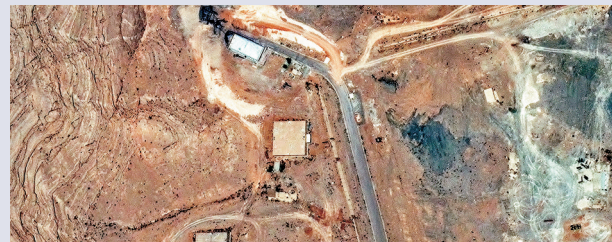
●衛星圖片顯示伊斯法罕核技術研究中心隧道入口去年在美以空襲中被炸毀。