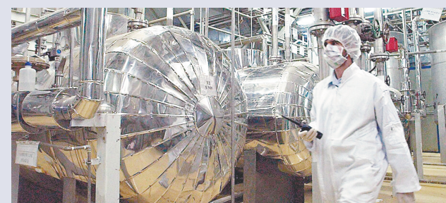
●伊朗伊斯法罕的鈾儲存設施。

香港文匯報訊 美國媒體引述消息人士稱，伊朗近日大幅強化境內高濃縮鈾儲存設施的封鎖措施，甚至故意炸毀隧道入口並埋地雷。5名美國情報消息人士指出，現在要取得這批約500公斤、接近武器級的高濃縮鈾，比1個月前更困難和危險，也更耗時。