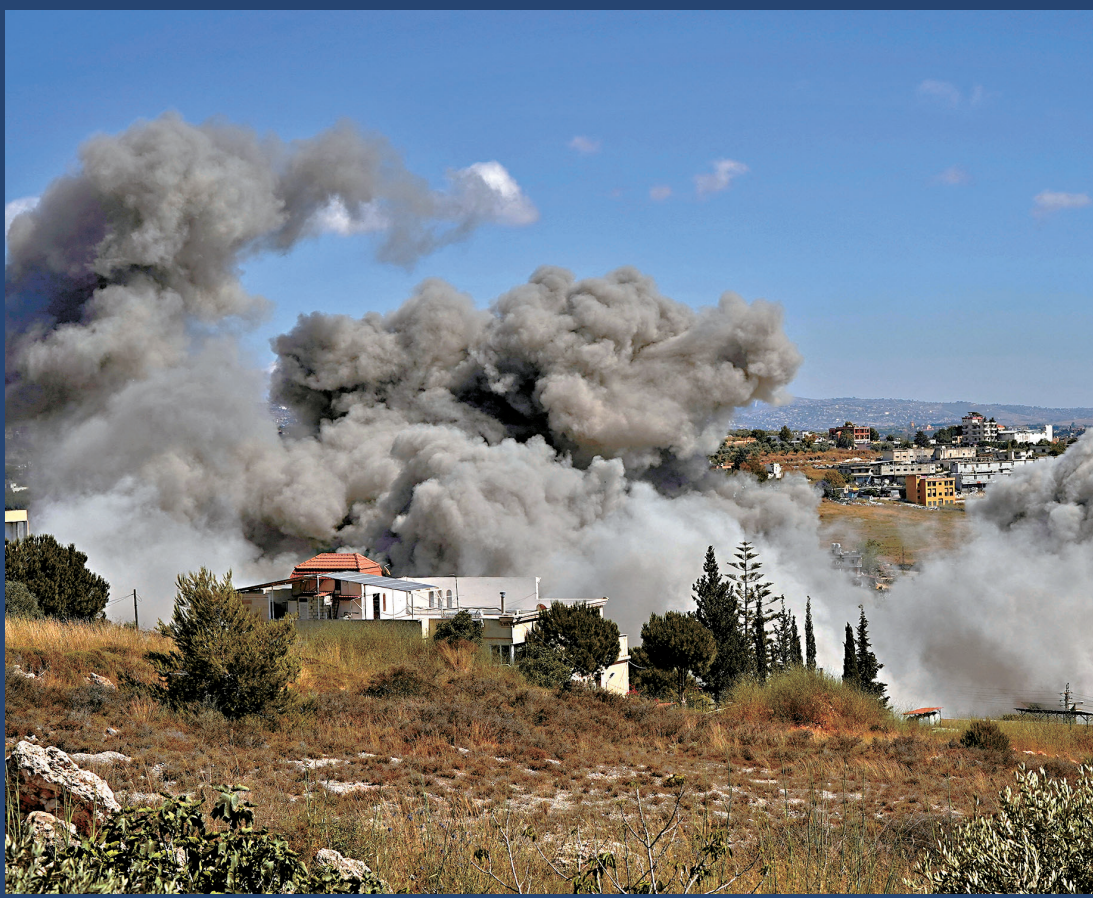
●黎巴嫩南部巴泰耶遭以色列空襲後冒出濃煙。

簽署停火協議，霍爾木茲海峽將在協議簽署後立即開放。巴基斯坦外交部也稱，美國與伊朗相關協議的電子簽署儀式定於14日舉行。不過一名接近伊朗談判團隊的知情人士稱，伊朗尚未就與美國的諒解備忘錄作出最終決定，相關審議工作仍在繼續。與此同時，伊方指責美國對以色列襲擊黎巴嫩「開綠燈」，表示伊美繼續推進對話因此「變得不可能」。