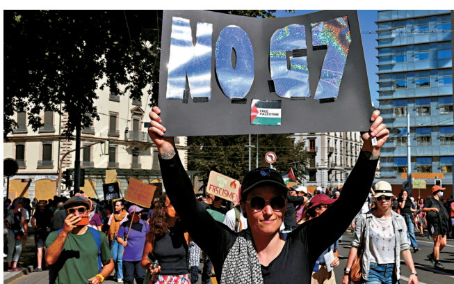
●日內瓦一名示威者高舉標語，反對G7峰會。