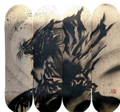
● Billy 在滑板上噴繪出作品《Force Beast》。