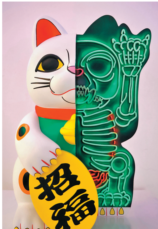
● Billy Hung 《Kouun Neko 50:50 / 400%》