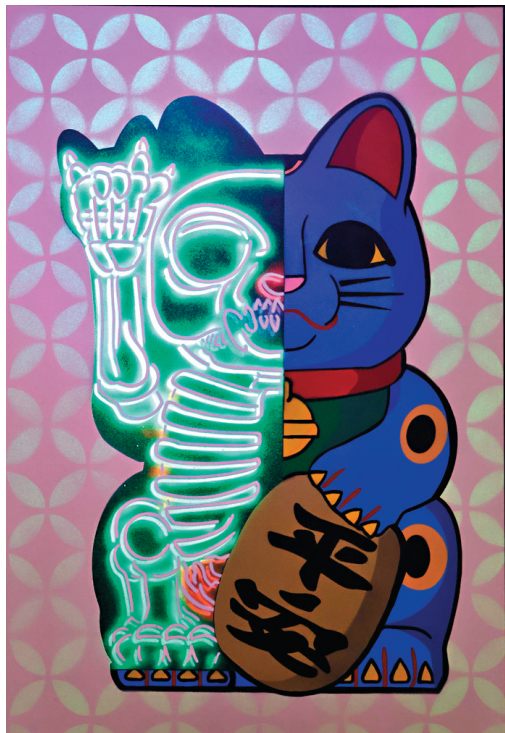
● Billy Hung 《Kouun Neko 50:50 Shippo (Reverse) Blue》