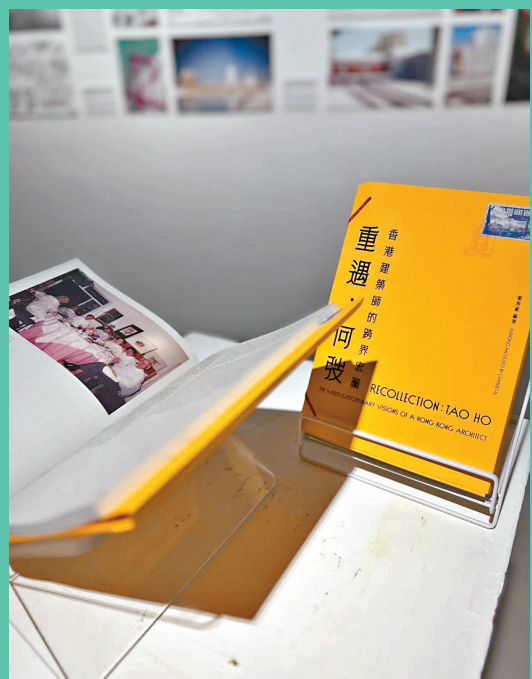
●該書歷經 7 年的策劃及資料收集後得已出版。