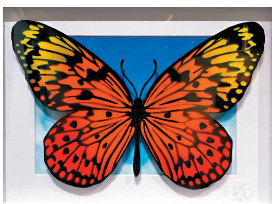
● Billy Hung 《Monarch-Good Vibes (Groovy)》

2018年後，為找尋自己理想的生活，Billy 辭職並發現自己對噴繪的興趣，於是放棄了一年制法學專業證書 (PCLL) 課程。他也於同年開辦工作室 Art Lab。