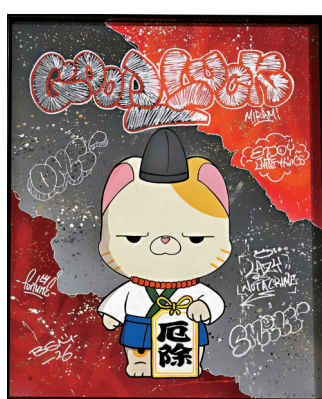
● Billy Hung 《Mirami-Prosperity》

疫情期間，他主要創作壁畫及鐵閘畫。其中一個創作就是灣仔和記餐廳的鐵閘畫，含有霓虹燈元素。而霓虹燈紋樣是 Billy 作品中的常客，包含着兒時的記憶。他亦喜歡將帶有霓虹燈元素的作品帶到海外，表示就像是帶着自己的「根