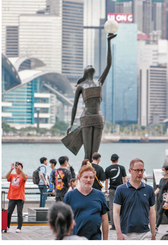
●在盛事吸引下，訪港旅客近年整體上升。圖為尖沙咀星光大道。

諮詢文件指出，應發揮香港作為中外文化藝術交流中心和亞洲盛事之都的優勢，推動文化、體育、旅遊及盛事協同發展，打造更多具香港特色和國際吸引力的產品與體驗；善用啟德體育園及其他大型場地，支持舉辦更多大型國際體育賽事、演唱會、文化活動和會展項目，帶動旅遊、消費及相關產業發展；以及推動文體旅協同發展，深化旅遊體驗以吸引高增值旅客。