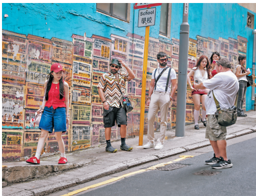
●旅客近年鍾情在香港特色地點「打卡拍照」。圖為中環一處網紅塗鴉牆。