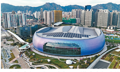
●啟德體育園啟用以來，香港盛事經濟效應持續發揮。 資料圖片