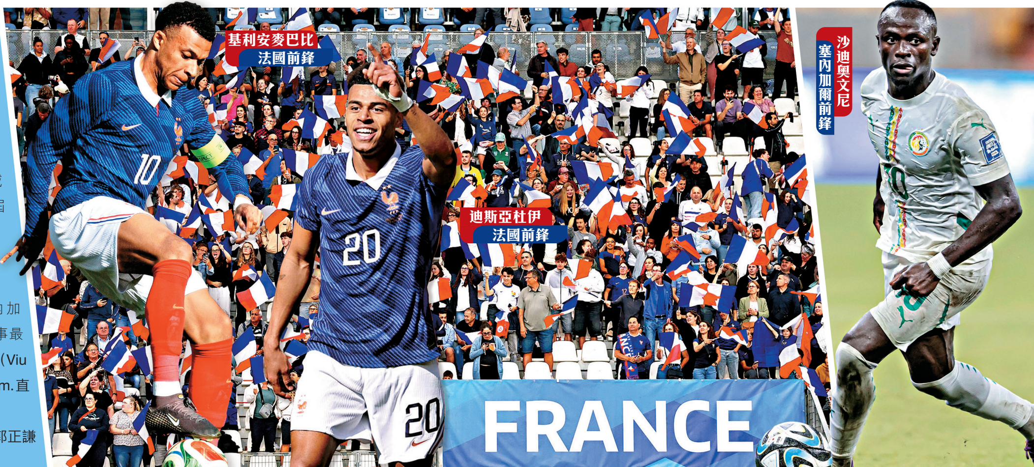
基利安麥巴比 法國前鋒