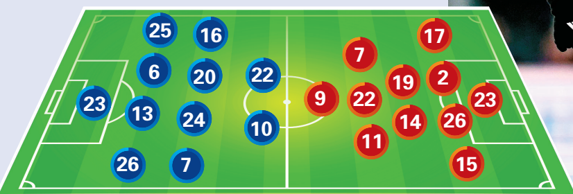
阿根廷預計陣容 VS 阿爾及利亞預計陣容

阿爾及利亞陣中除有近兩仗合共轟入四球的鋒線雙槍高爾尼與夏治梅沙外，最受矚目的莫過於效力德甲華古遜、年僅20歲的中場新星伊巴謙馬沙。由於腳法細膩，他在球會被冠以「馬沙當拿」的綽號。這位小將賽前高調挑釁，揚言球隊絕對有能力「擊敗美斯」。