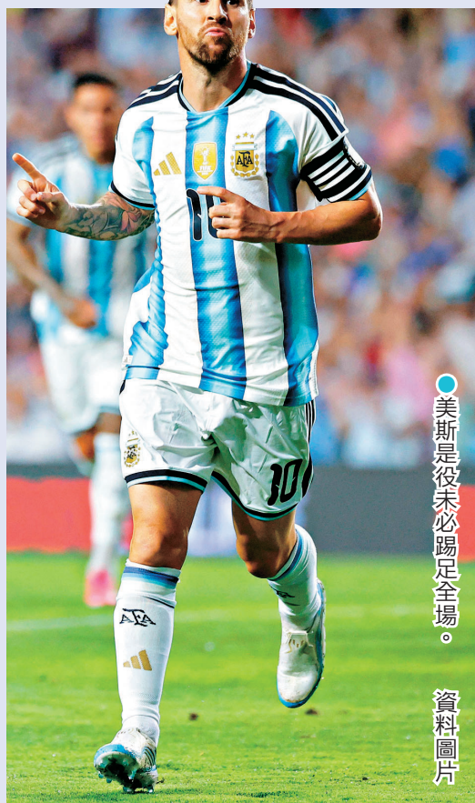
● 美斯是役未必踢足全場。