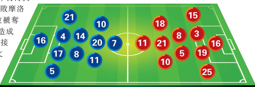
法國預計陣容 VS 塞內加爾預計陣容

霸非洲國家盃，轉正後的他去年初再次率領塞軍殺入非洲盃決賽並擊敗摩洛哥，但卻因尾段拉離場而被褫奪冠軍。柏比泰奧將塞內加爾打造成一支以高強度的壓迫和快速直接反擊見稱的球隊，以沙迪奧文尼、尼高拉斯積遜以及伊斯美拿沙亞等速度型球員為進攻核心，但論個人能力及陣容深度始終比不上星光熠熠的法國，雖然可藉反擊為法國防線製造一些威脅，但欠缺領軍人物的防線恐難阻阻巨星們的侵襲，相信法國今仗可以小勝一場，為今屆世界盃之旅打響頭炮。