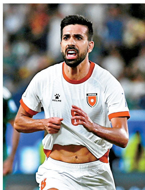
● 艾拉華達是約旦中場主力。資料圖片