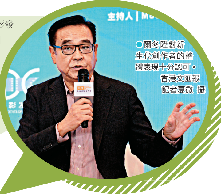
○爾冬陞對新生代創作者的整體表現十分認可。香港文匯報記者夏微攝