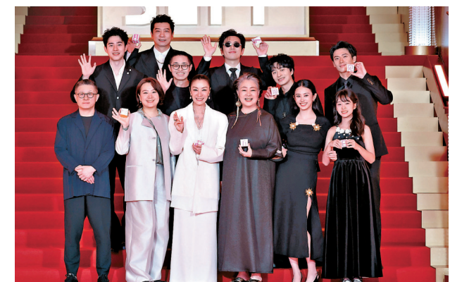
●《魔方小姐》劇組亮相紅毯。網上圖片

翌日，劇組亮相2026微博電影之夜。在「光影寄換」環節中，眾人展現多元扭計骰，以極具創意的互動形式，祝福大家都能像扭計骰般，在方寸之間轉出人生的無限可能。隨後，主創團隊帶著巨型扭計骰走上紅毯，正如導演白雪所說：「魔方有4,325億種可能，人生也是。」在主創互動環節，大銀幕上呈現的「喪氣句子」被主角們以角色視角逐一「翻轉」為充滿力量的積極回應，完美詮釋了影片「打破偏見」，任何時候開始都不為晚的治癒核心。