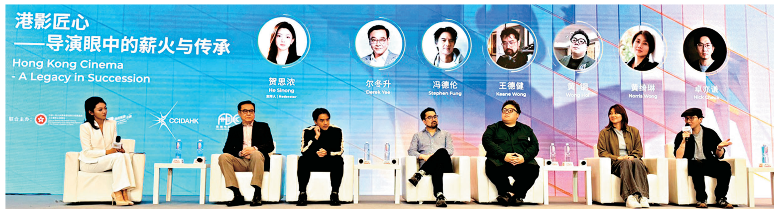
● 眾人各抒己見。

香港特區政府文創產業助理專員兼香港電影發展局秘書長麥聖希表示，為推動香港電影業的發展與革新，已推出多項針對性的資助計劃，包括「電影製作融資計劃」，為中低成本電影製作提供資金，「首部劇情電影計劃」則資助新導演，將首部長片搬上大銀幕。他說：「人才是電影藝術的基石，而『薪火相傳』計劃真正體現了深遠的傳承價值。香港電影屢創佳績，有賴于演員毫無保留的經驗分享，以及對新人的提攜。」