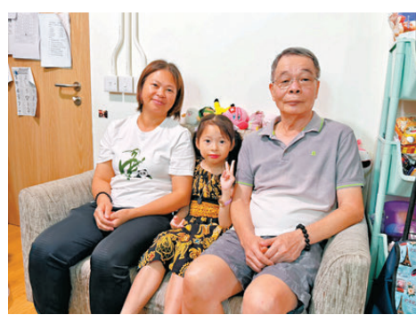
●杜先生、杜太太一家人對夏主任的關心感到非常開心。