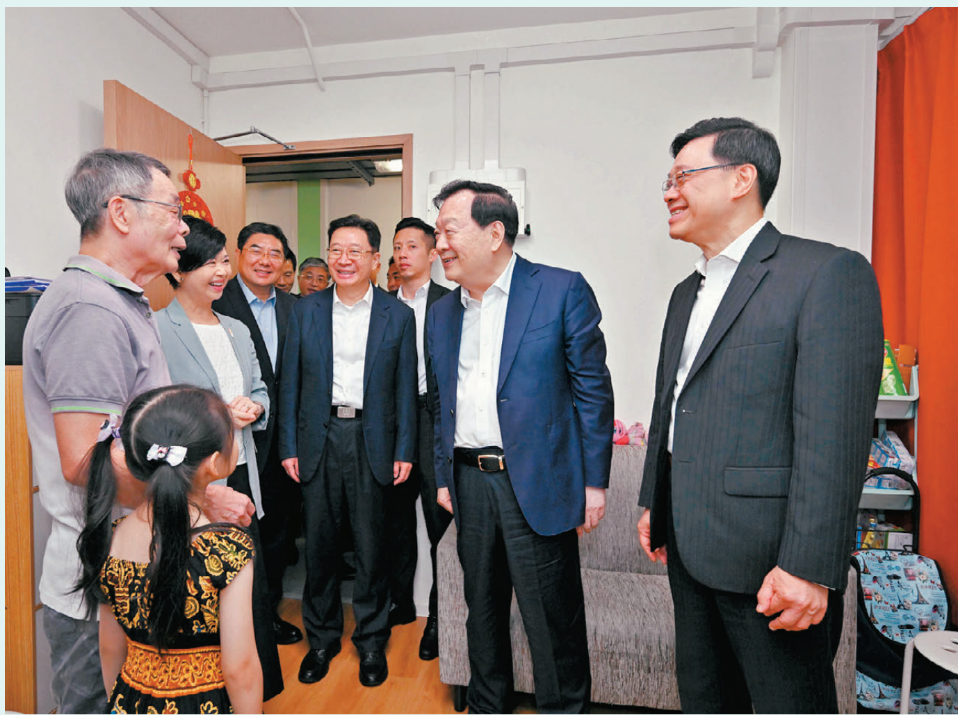
●夏寶龍考察元朗簡約公屋項目。