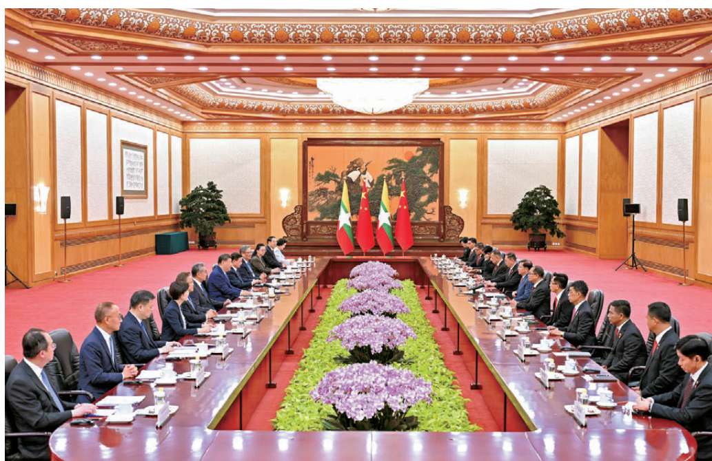
▲6月16日上午，國家主席習近平在北京人民大會堂同來華進行國事訪問的緬甸總統敏昂萊舉行會談。新華社