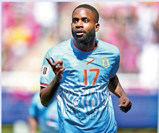
● 剛果民主共和國仍依靠老将巴卡保支撐大局。

香港文匯報訊(記者 楊浩然)世界盃K組首輪賽事於香港時間周四(18日)凌晨上演,坐擁無敵中場的葡萄牙面對剛果民主共和國,該有力憑質取勝(Now616及618台周四1:00a.m.直播)