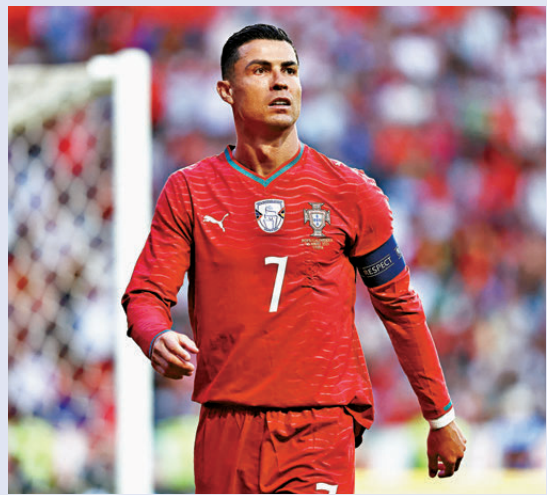
● 葡萄牙希望C朗拿度能及時復甦。 資料圖片