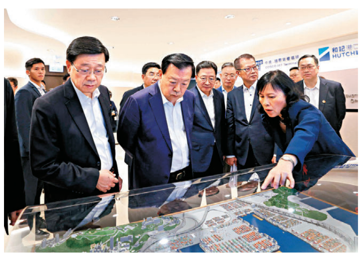
●夏寶龍考察香港葵青碼頭。

定不移地貫徹國家「十五五」規劃的重大戰略部署，與海內外航運業界攜手並進，以創新科技與綠色轉型為雙帆，以「全球航運之都」作為航行目標破浪前進。