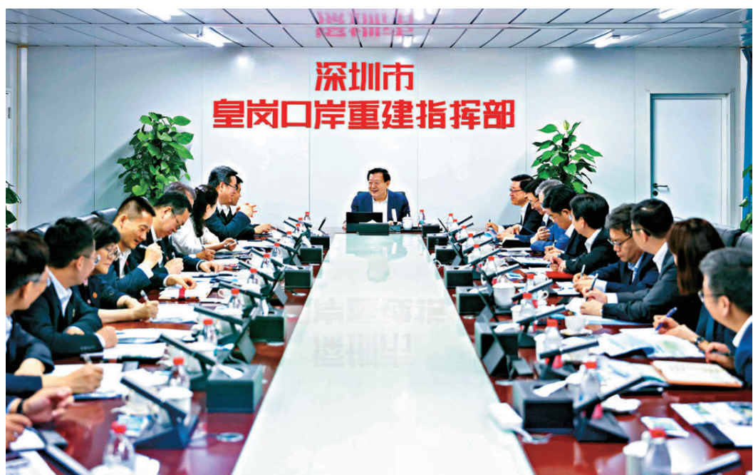
夏寶龍考察新皇崗口岸。

中央港澳工作辦公室主任、國務院港澳事務辦公室主任夏寶龍昨日上午在行政長官李家超一行陪同下到深圳新皇崗口岸考察調研。李家超昨日在傳媒時被問及新皇崗口岸啟用時間，他表示，新皇崗口岸的主體結構建築工程已經大致完成，待全國人大常委會在下周完成審議授權香港對皇崗口岸港方口岸區實施管轄決定草案，以及取得人大授權決定和國務院的相關批覆後，香港特區政府會進行本地立法，落實有關議案涉港部分的要求及相關規管事宜，務求在本地立法完成後，盡快將新皇崗口岸開通，方便兩地人員使用。 ●香港文匯報記者 黃子晉、黃子龍