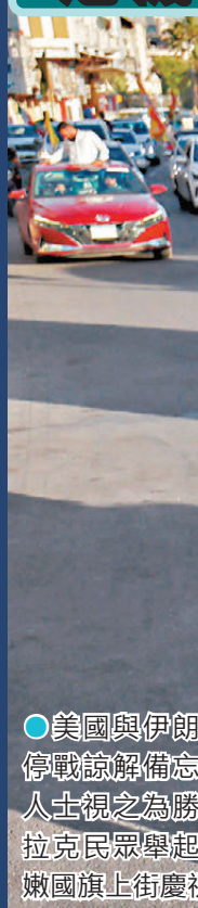
● 美國與伊朗將正式簽署停戰諒解備忘錄，親伊朗人士視之為勝利。圖為伊拉克民眾舉起伊朗及黎巴嫩國旗上街慶祝。

據黎巴嫩國家通訊社報道，以色列軍方16日下午使用無人機襲擊黎南部，初步統計造成4名平民死亡及多人受傷，17日再對黎南部奈拜耶地區發動空襲和炮擊。以軍16日發聲明說，他們攔截了真主黨向黎南部以軍行動區域發射的火箭彈，並摧毀一個火箭彈發射器。他們發現有士兵在一輛可疑車輛附近活動，於是向該車輛鳴槍示警，隨後進行打擊「以消除威脅」。