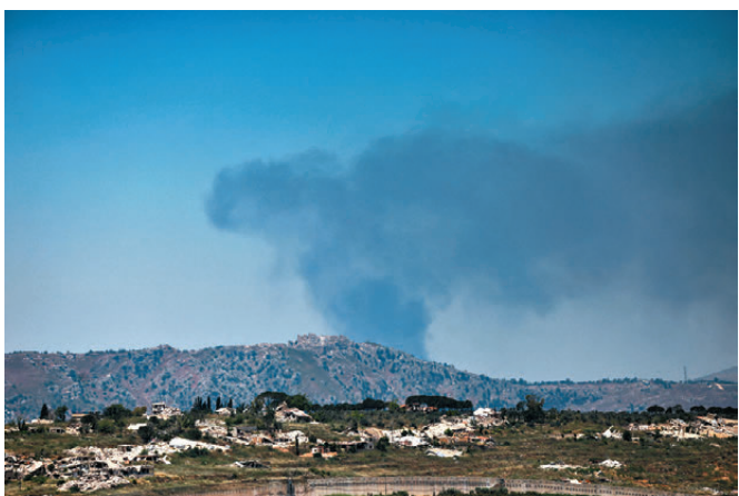
● 伊朗指以軍在黎南部違反停火協議至少84次。

以色列官員明確表示，即使美伊達成協議，以色列仍將根據自身安全需求決定軍事部署。美國哥倫比亞廣播公司(CBS)報道，部分以色列官員更直接指出，「特朗普的協議不約束我們」，強調以色列不會因美伊協議而調整既定軍事政策。伊朗則警告若以軍持續駐留黎巴嫩境內，將被視為違反新達成的停火安排。