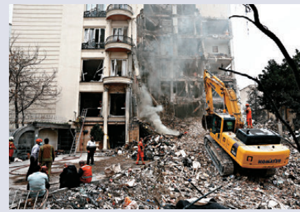
● 德黑蘭有多棟建築物受損。資料圖片

知情人士特別指出，這項私人投資基金與解除美國制裁、解凍伊朗海外資產的官方談判完全獨立，兩者屬於不同的金融機制，擁有不同的目的及時間表。該基金必須在雙方最終達成令人滿意的協議後，才會正式成立並運作。一旦雙方於19日簽署諒解備忘錄，預計將在接下來的60天內為整個投資流程建立具體架構。在該段過渡期內，基金管理單位將與伊朗及各國投資者合作，共同規劃與評估投資專案，惟目前關於該基金將如何管理及由誰負責等部分細節，仍待最終敲定。