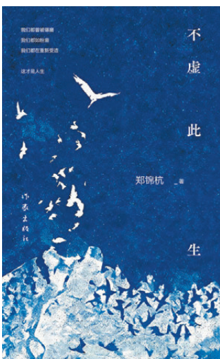
●鄭錦杭的長篇詩體小說《不虛此生》

懷揣敬畏，鄭錦杭毅然開啟更為艱巨的修改之路。那是一段極致的孤獨與苦修——摒棄外物干擾，晝夜打磨字句，對全書人物逐一校準，豐盈內心層次，增補鮮活人物，深化教育、人性、時代等多重思