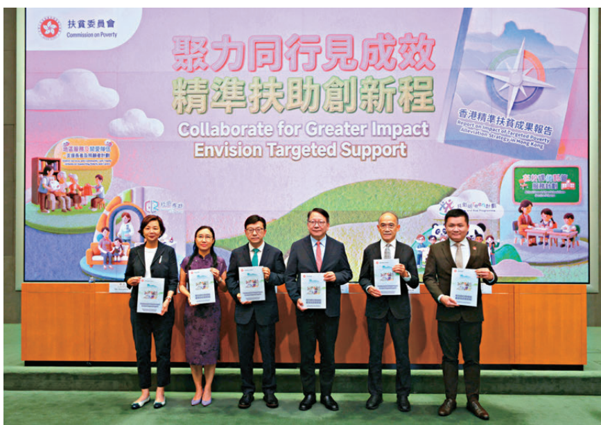
●左起：扶貧委員會委員李玉芝、勞工及福利局常任秘書長劉焯、勞工及福利局局長孫玉菡、政務司司長陳國基、扶貧委員會委員郭振華及扶貧委員會委員李樹主持香港精準扶貧成果報告記者會。