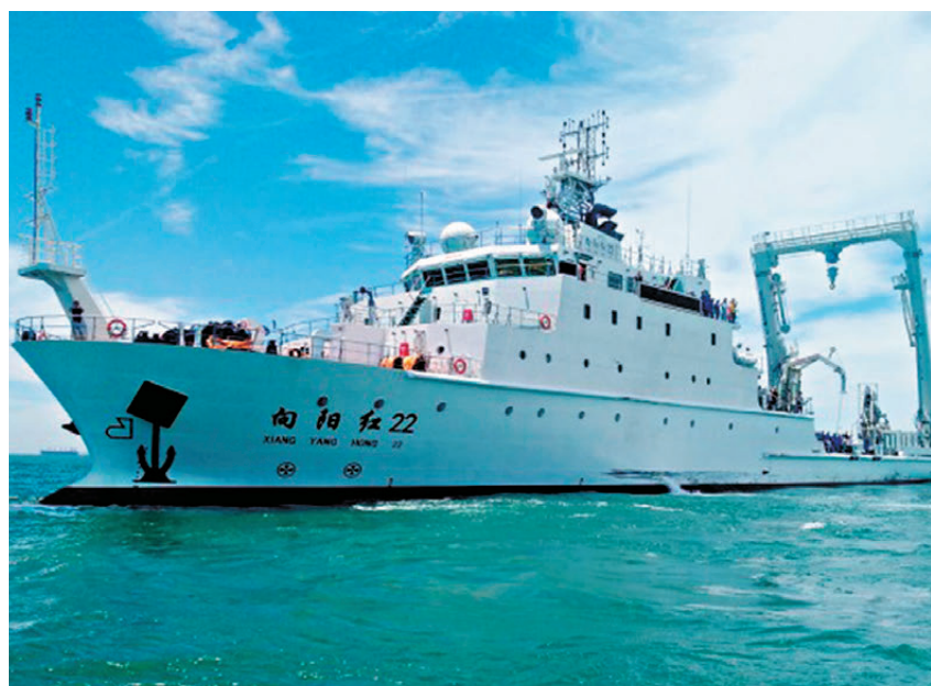
●「向陽紅22」是中國首艘3,000噸級大型浮標作業船。