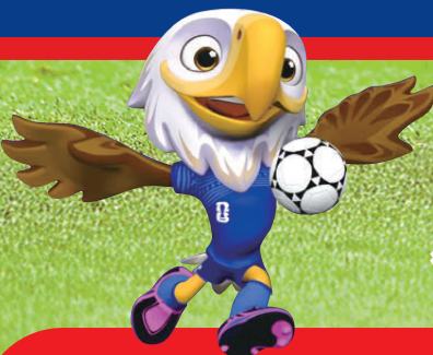
● C朗於首戰踢足全場，表現卻如「隱形人」。