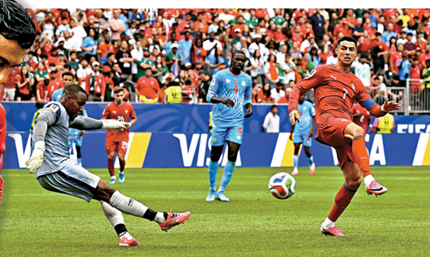
● C朗（右）全場三次起腳，但全部未能命中目標。