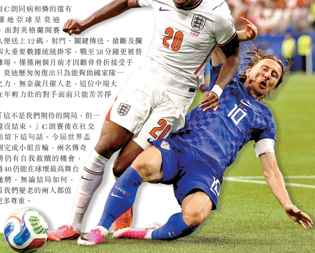
● 莫迪歷（右）是役表現失色，更向對手送12碼。

「這不是我們期待的開局，但一切還沒結束。」C朗賽後在社交網站留下這句話。今屆世界盃才剛完成小組首輪，兩名傳奇老將仍有自我救贖的機會，年過40仍能在球壇最高舞台上馳騁，無論結局如何，陪著我們變老的兩人都值得更多尊重。