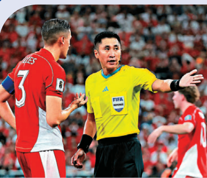
● 馬寧將於周日擔任厄瓜多爾對庫拉索一仗的主球證。