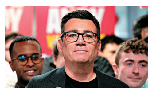
●伯納姆被視為梅克菲爾德選區補選熱門人選。

梅克菲爾德選區是工黨傳統票倉，但極右翼改革黨在當地影響力日增。改革黨今次派出地方議員凱