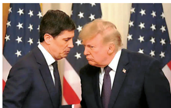
●特朗普(右)與沃什早前在沃什的就職儀式上交談。

香港文匯報訊 沃什首次以聯儲局主席身份主持會議，便給聯儲局的運作與溝通方式打上個人印記。《華爾街日報》指出，沃什打破聯儲局傳統，沒有提交點陣圖預測，這種模糊處理的方式變相減少干預，為確保聯儲局獨立性邁