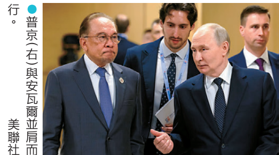
●普京(右)與安瓦爾並肩而行。

普京當日舉行招待會，歡迎出席的東盟成員國代表。他致辭時稱，是次峰會將擴大互利的貿易、投資和產業合作創造新的機遇，同時加強雙方商界之間的直接對話。在峰會期間，普京已分別與文萊蘇丹博爾基亞，以及馬來西亞總理安瓦爾舉行雙邊會談，他強調俄羅斯與東盟的戰略夥伴關係，是亞太地區重要的穩定因素。