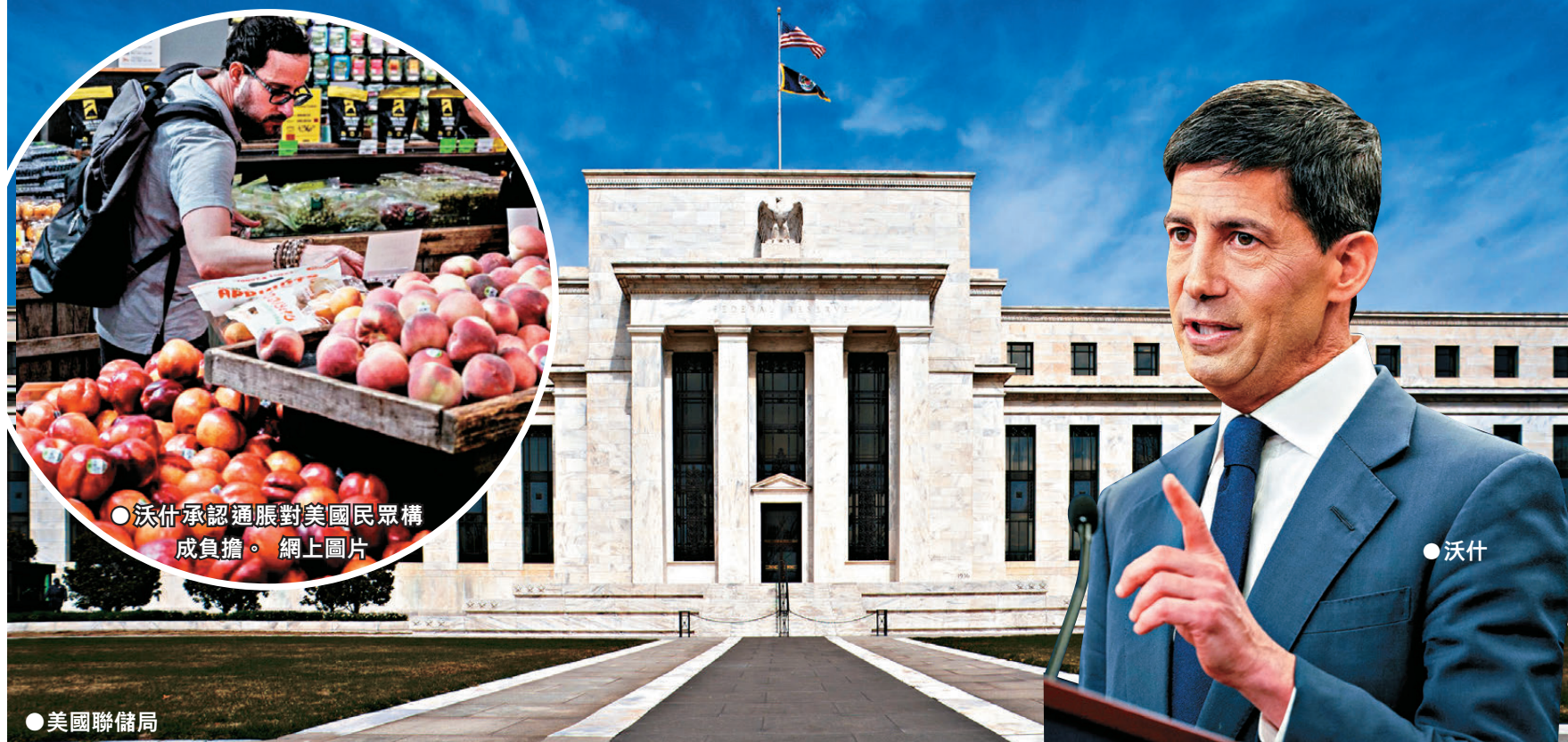
●沃什承認通脹對美國民眾構成負擔。