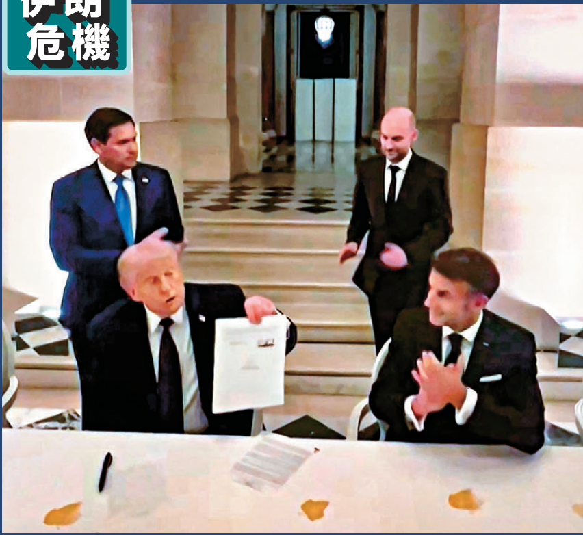
●特朗普(左下)在馬克龍見證下簽署諒解備忘錄。

香港文匯報訊 美國總統特朗普與伊朗總統佩澤希齊揚6月17日分別宣布，雙方已經簽署一份旨在結束衝突、開放霍爾木茲海峽的諒解備忘錄，雙方是分別簽署，沒有舉行任何簽署儀式。據報美方在最後時刻作出多項讓步，涵蓋黎巴嫩局勢、伊朗濃縮鈾和霍爾木茲海峽開放事宜，美方據報也會解凍伊朗部分被凍結資金並解除制裁。