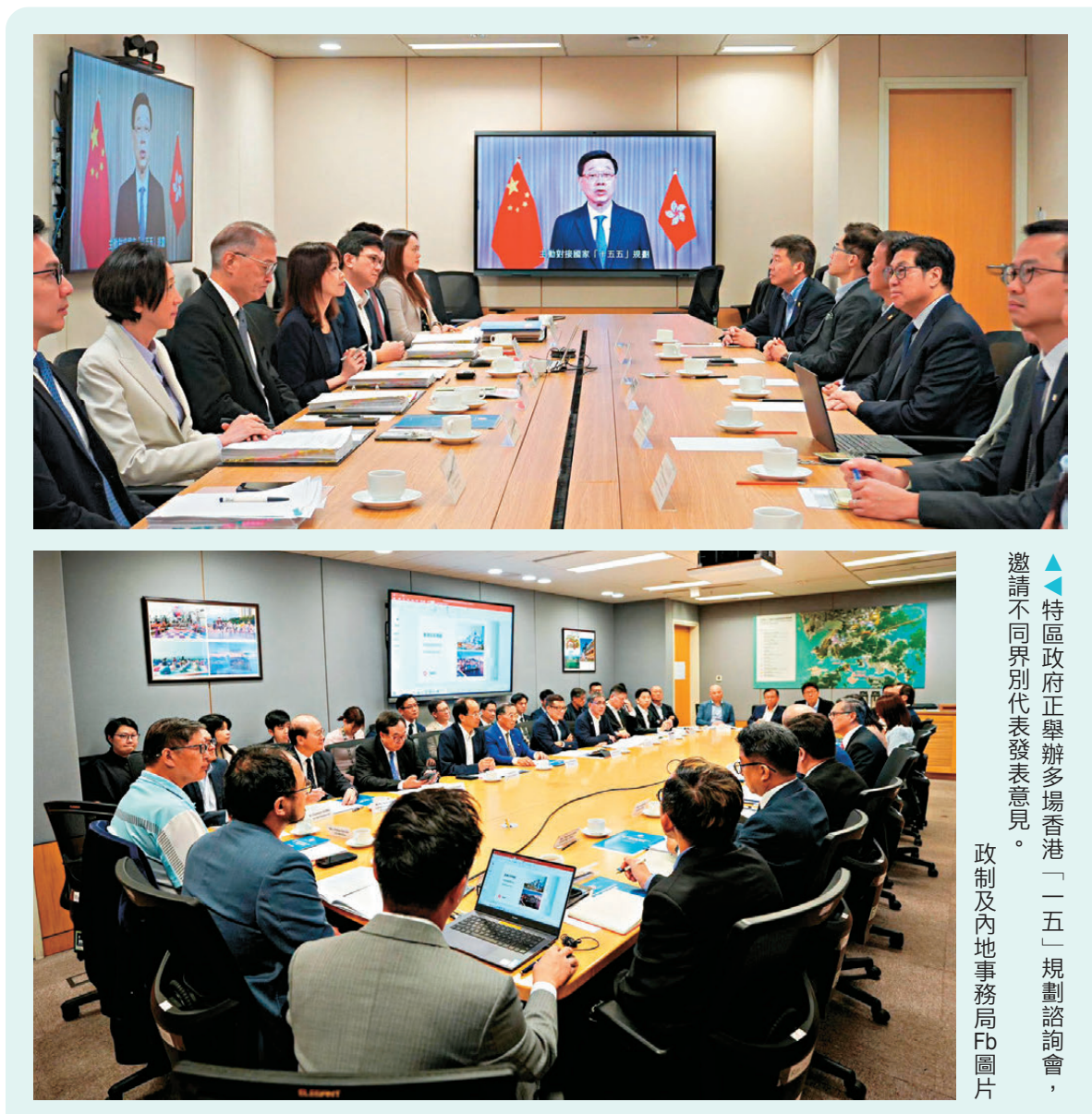
▲特區政府正舉辦多場香港「一五」規劃諮詢會，邀請不同界別代表發表意見。

香港明年將迎來回歸祖國30周年，李家超表示，今次是邁向治及興新征程上的30周年紀念，意義重大，已成立由政務司司長負責的特別委員會部署慶祝和優惠活動，同時會就香港「一五」規劃重點項目，做好宣傳推廣工作。