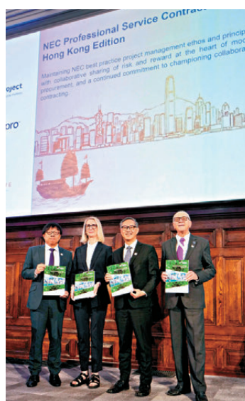
●發展局推出香港版「新工程合約」一專業服務合約。

此外，土木工程拓展署有多個NEC合約基建項目競逐是次「Martin Barnes」獎項，最終於全球約80個參賽項目中脫穎而出，勇奪5個獎項。該獎項由英國土木工程師學會轄下「新工程合約」組織頒發，主要表揚世界各地在採用NEC合約模式有出色表現的機構及項目。