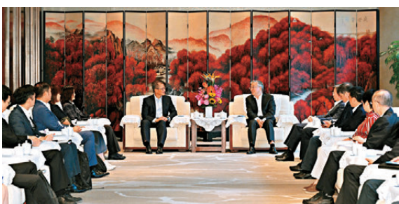
▲陳茂波拜會南京市委書記周紅波。