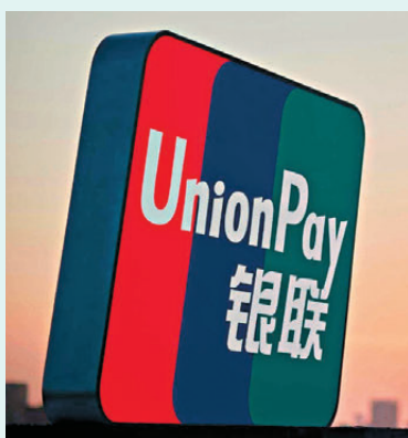
●中國銀聯4月在上海發布《智能體支付開放協議框架》，並實現5筆生產系統驗證交易。