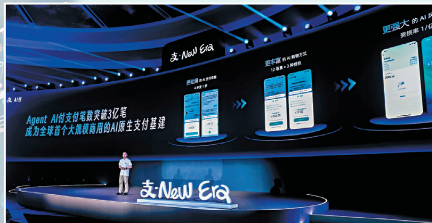
●支付寶宣布AI支付已完成3億筆AI智能體支付。