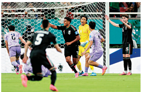
●路爾斯洛慕（中）門前補中，為墨西哥奠定勝局。