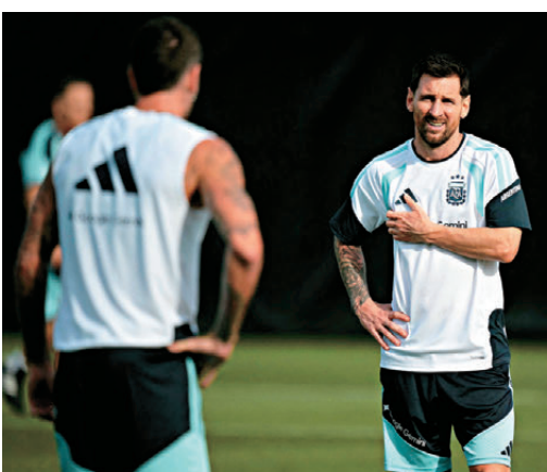
●美斯昨未受父親病情影響，照常隨隊操練。

香港文匯報訊（記者張發兒）阿根廷球王美斯在世界盃分組賽首戰連中三元，但期間不禁落淚，原來是因為其父親病重，令他十分擔憂。