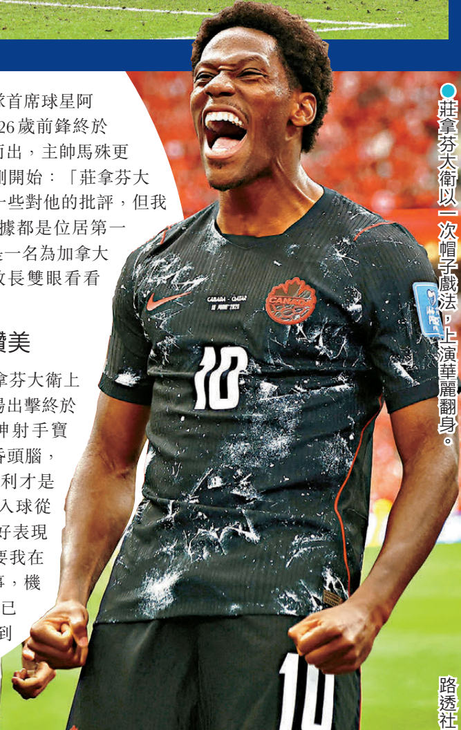
●莊拿芬大衛以一次帽子戲法，上演華麗翻身。

四年前的卡塔爾世界盃，莊拿芬大衛上陣三場一球未入，來到今屆主場出擊終於為自己正名，甚至有力爭奪神射手寶座，不過他未被漫天的讚賞衝昏頭腦，外號「冰人」的他強調球隊勝利才是最重要的一環：「對我來說，入球從來不是最重要，球隊能夠踢出好表現並且贏波才是關鍵。我知道只要我在場上發揮出水平、做着正確的事，機會總會來到我面前。我們現在已邁出了重要一步，球隊希望做到的是繼續改變加拿大足球在所有人心目中的印象。」