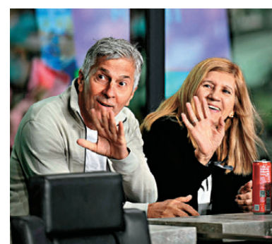
●據報美斯父親佐治（左）正接受胰腺癌治療。資料圖片

阿根廷在2026世界盃分組賽首戰強勢擊敗阿爾及利亞，隊長美斯在攻入一球後情緒激動，落下男兒淚，這一幕成為今屆賽事開局階段最震撼人心的畫面之一。美斯透露，自己在足球以外正面對一段艱難時期：「這完全與競技無關。我經歷了幾天很艱難、很複雜的日子。」