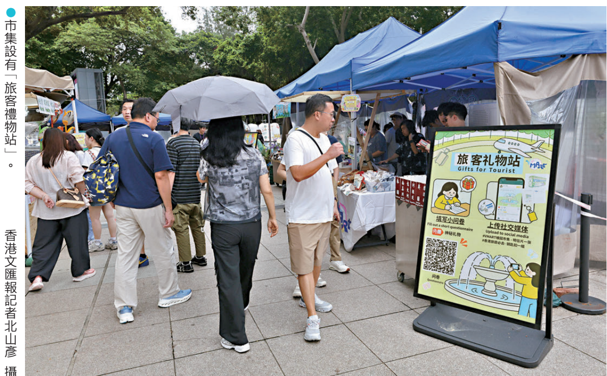
市集設有「旅客禮物站」。