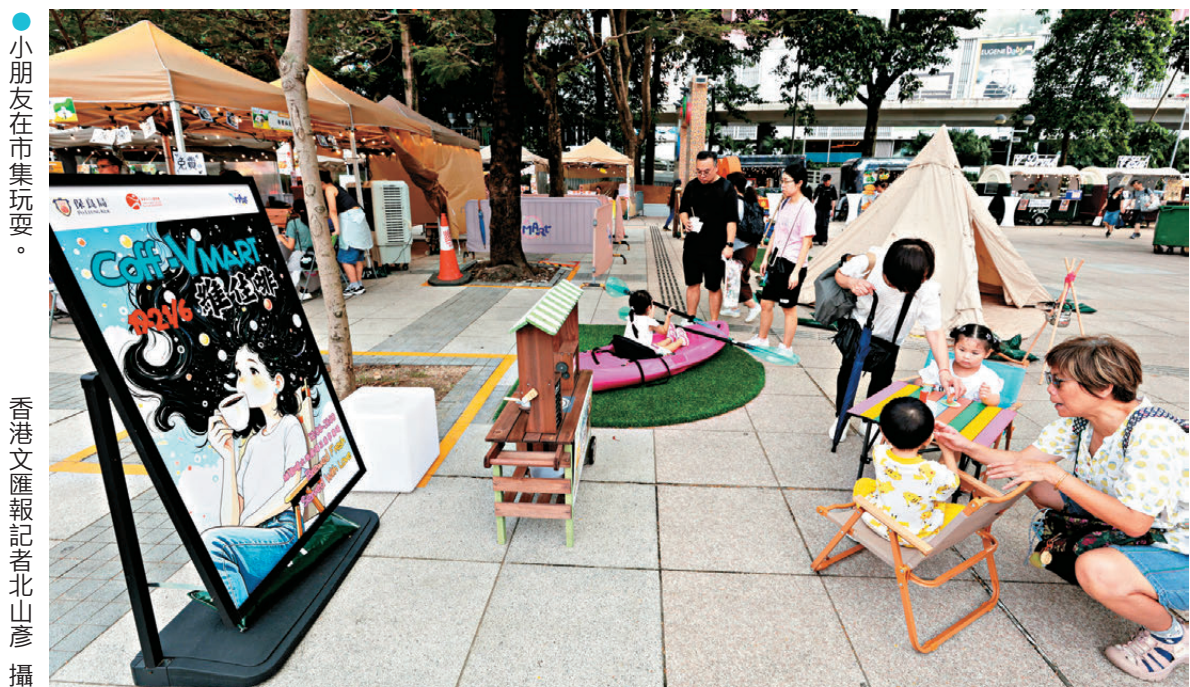
小朋友在市集玩耍。