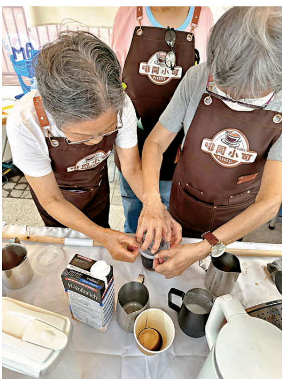
「老友記」製作咖啡。

土力工程處在社交專頁表示，截至昨日上午9時，緊急控制中心共接獲兩宗山泥傾瀉報告，前日傍晚6時後沒有新增報告，而早前受山泥傾瀉