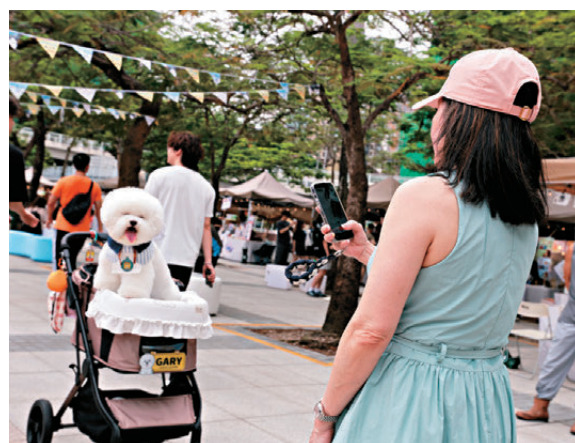
愛犬之人帶同寵物入場。