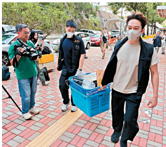
重案組探員到荔景邨命案現場調查。

香港文匯報訊（記者 蕭景源）昨日下午1時許，警方接獲葵涌荔景邨風樓一名56歲女子報案，指其80歲母親昏迷倒臥床上，臉部遭被鋪遮蓋，其71歲父親上吊昏迷。救援人員接報趕至，隨即把兩人由救護車急送醫院搶救，惜80歲婦人最後不治。警方封鎖現場，重案組探員及鑑證科人員其後到場調查及搜證。