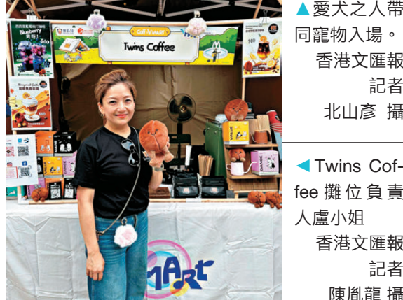
Twins Coffee攤位負責人盧小姐。