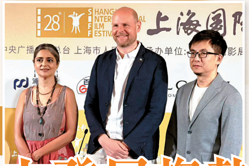
●中國動畫導演於水(右)與英國動畫導演威爾·比徹(中)等出席上影節活動。

從《大鬧天宮》《小蝌蚪找媽媽》到《哪咤之魔童鬧海》《浪浪山小妖怪》，中國動畫經歷了領先、沉寂後又重新崛起，如今，中國動畫已走過百年歷程，國漫正向世界展示獨具民族風格的中國美學。在今年上影節期間，多位資深動畫導演表示，中國動畫正迎來向上發展趨勢。中國動畫導演於水表示，希望創作出足夠好的動畫作品，讓觀眾來用腳投票，英國動畫導演威爾·比徹表示，越來越多的中國影視作品已經衝向國際舞台，「這對於國際影人來說是非常矚目的。」 ●香港文匯報記者 倪夢環 上海報道