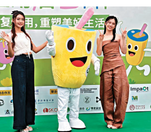
●戴祖儀(左)和倪嘉雯分享堅持多年的環保習慣。 香港文匯報記者李薇攝

香港文匯報訊(記者 李薇 深圳報道)第二屆深圳「環保重用日」大型環保市集昨日在領展中心城啟幕，TVB藝人戴祖儀和倪嘉雯受邀擔任「重用體驗官」出席活動，並分享堅持多年的環保習慣。