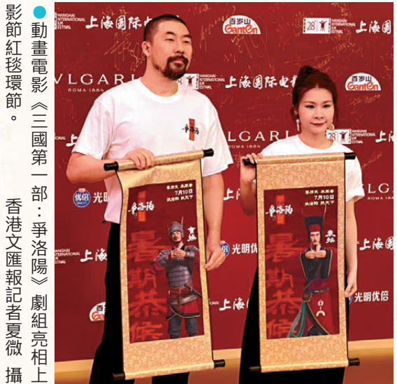
●動畫電影《三國第一部：爭洛陽》劇組亮相上影節紅毯環節。

於水憑藉《中國奇譚：小妖怪的夏天》被大眾熟知，後來推出了長片作品《浪浪山小妖怪》收穫不俗口碑與票房，「創作上我習慣從一個有趣的故事梗概出發，不會預設主題，避免表達用力過度。」面對本土與全球市場的問