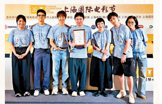
●《大西洋》主創合影。

分鐘內服服帖帖，迅速給了我極大的啟發，然後回到家裏我就希望如果她來參演我故事裏那個異想天開、充滿好奇的這麼一個實驗音樂人，我覺得會很有意思。」