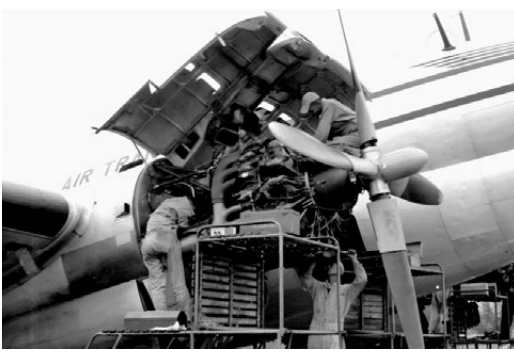
●陳納德民航空公司在台灣執行秘密任務。

在啟動產權交易後，陳納德在香港啟德機場對兩航飛機採取了控制措施。他先是僱傭一批在香港的印度錫克人作為守衛，強行「保護」飛機，阻止中方人員靠近。然後又命人偷偷將兩航飛機的輪胎全部放氣，甚至拆除輪胎或用卡車堵塞跑道等，千方百計不讓飛機飛走。與此同時，陳納德向香港地方法院起訴，要求將兩航資產和停留香港的飛機判給他的美國民航空公司。香港法院一審、二審均判陳納德敗訴，兩航資產歸屬新中國，台灣無權轉賣。但後來在美國強力施壓下，英國樞密院做出終審改判，將兩航71架飛機判給陳納德旗下美國民航空公司。港英警方出動武力接管啟德機場兩航資產，強行將飛機、航材交付陳納德民航空公司。陳納德民航空公司通過侵吞「兩航」飛機極大