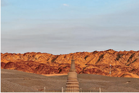
●敦煌莫高窟佛塔 作者供圖

現在再回頭看「救人一命，勝造七級浮屠」，其實就是修佛修的是內在的自己，修的是自己的本來面目，而不是一味追求外在的東西。造一座七級佛塔已是莫大功德，而拯救一條鮮活的生命，比修塔積德更加珍貴。對自我的拯救和成長更為重要。這短短一句話，其實就是最樸素的道理：世間一切功德，終究抵不過人心向善、救人於危難之中。