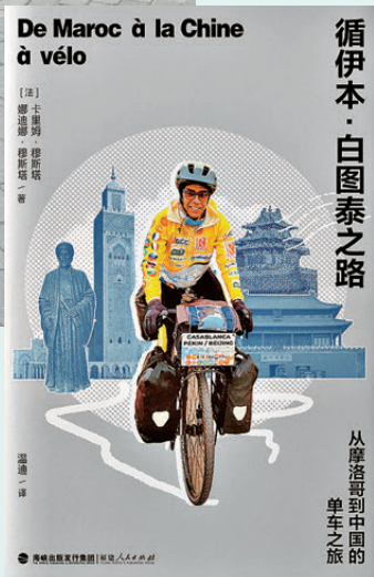
▲卡里姆將出版《循伊本·白圖泰之路：從摩洛哥到中國的單車之旅》。圖為書籍封面。